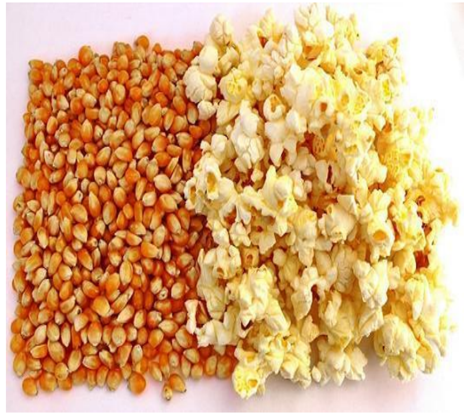
Взрывающаяся кукуруза и попкорн.