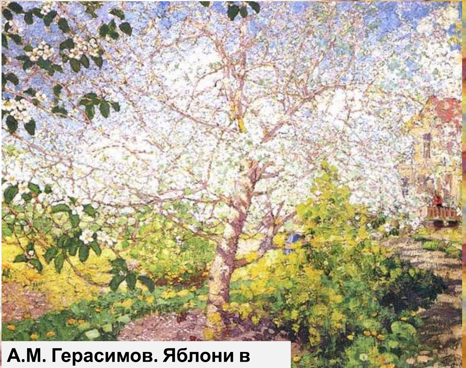
А.М. Герасимов. Яблони в цвету.