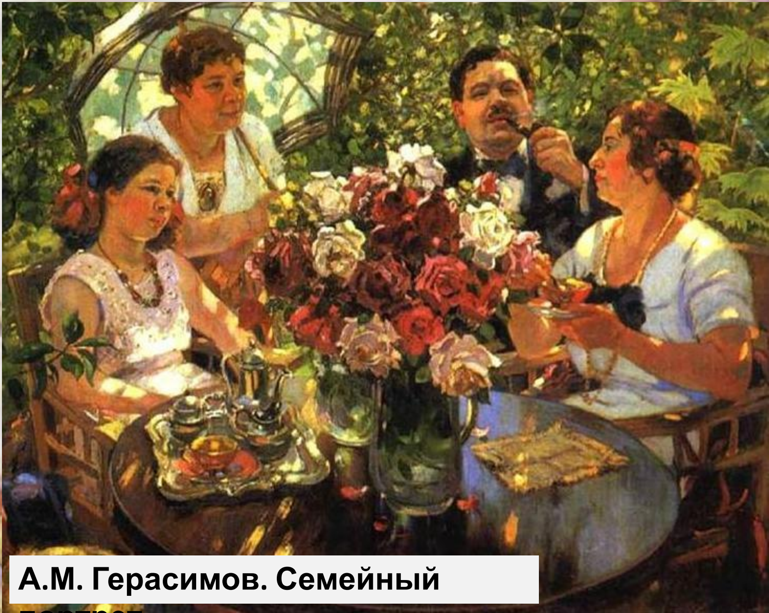
А.М. Герасимов. Семейный портрет.