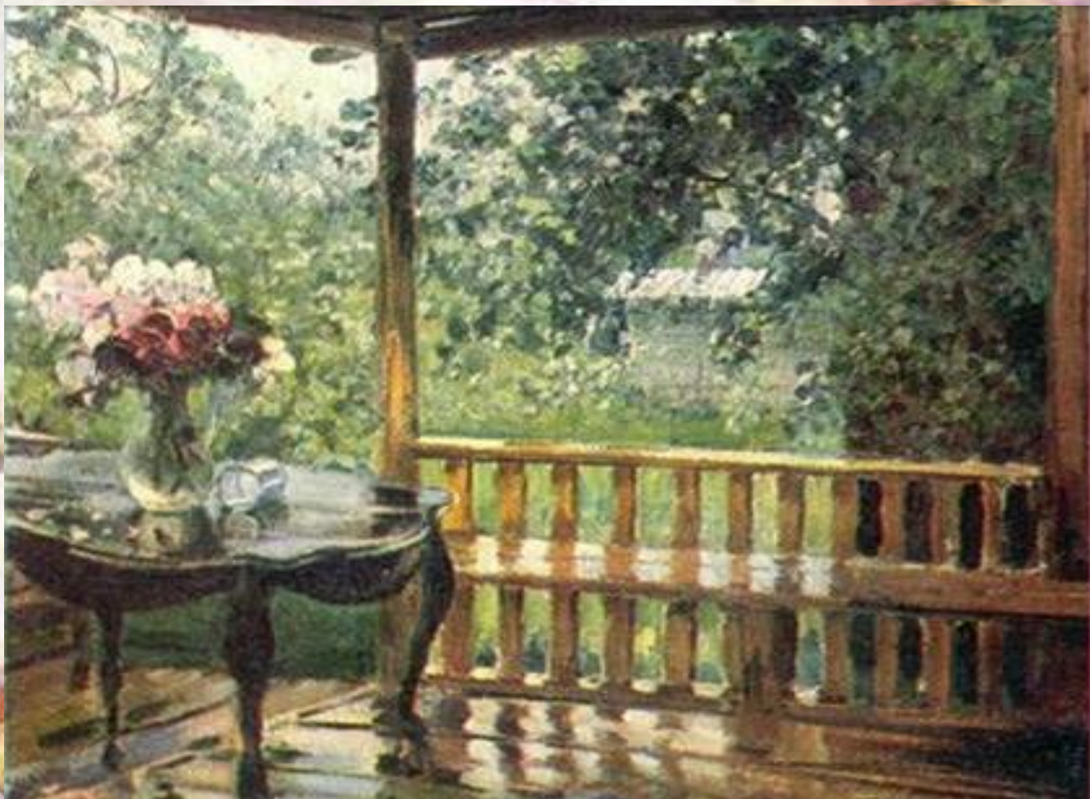
А.М. Герасимов. После дождя (Мокрая терраса)