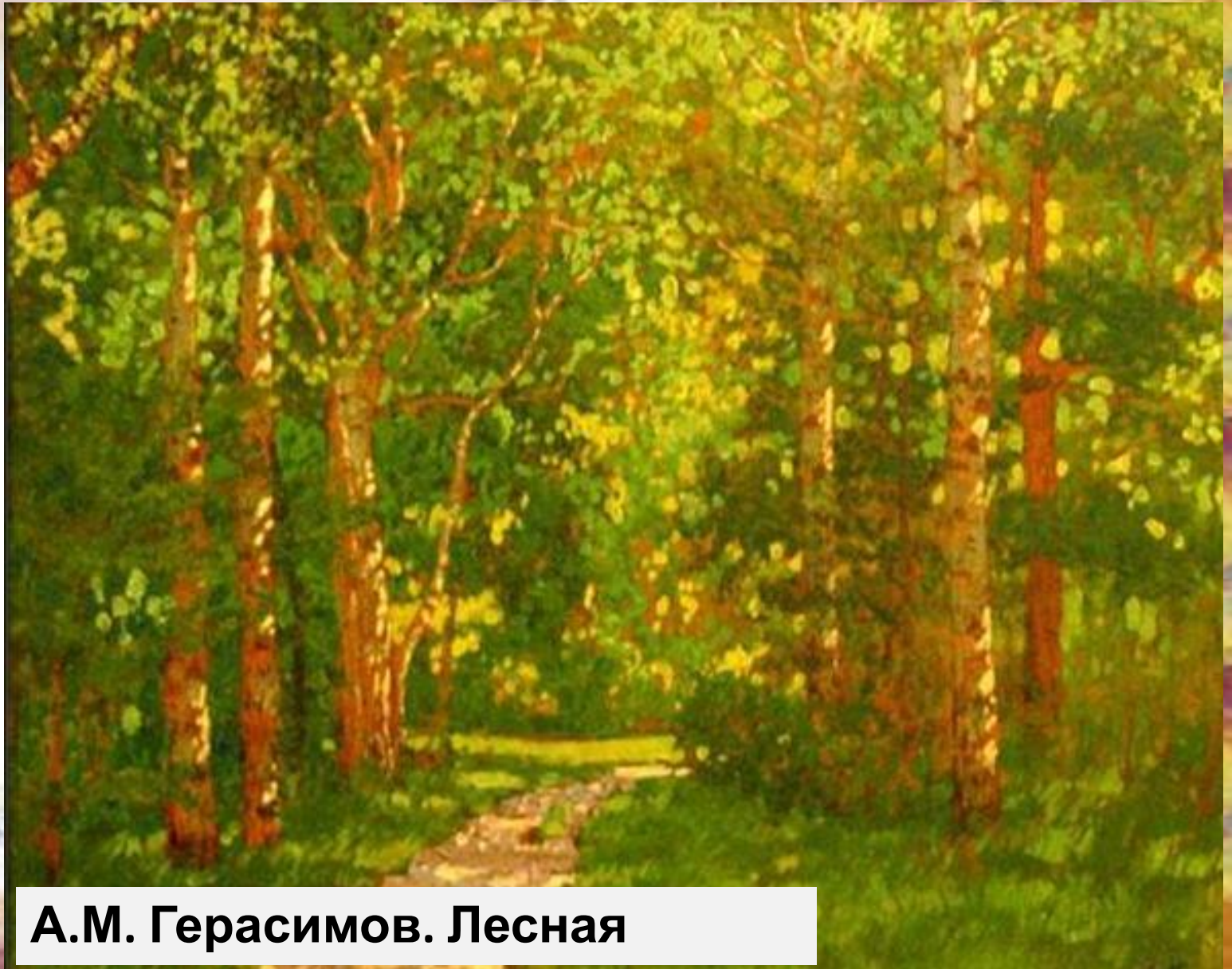
А.М. Герасимов. Лесная тропинка