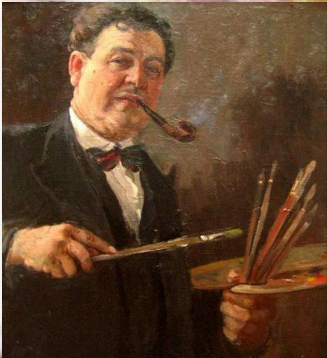
А.М. Герасимов. Автопортрет