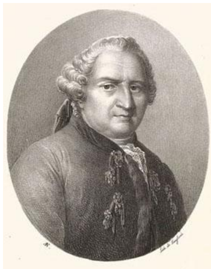
Анри Луи Дюамель де Монсо