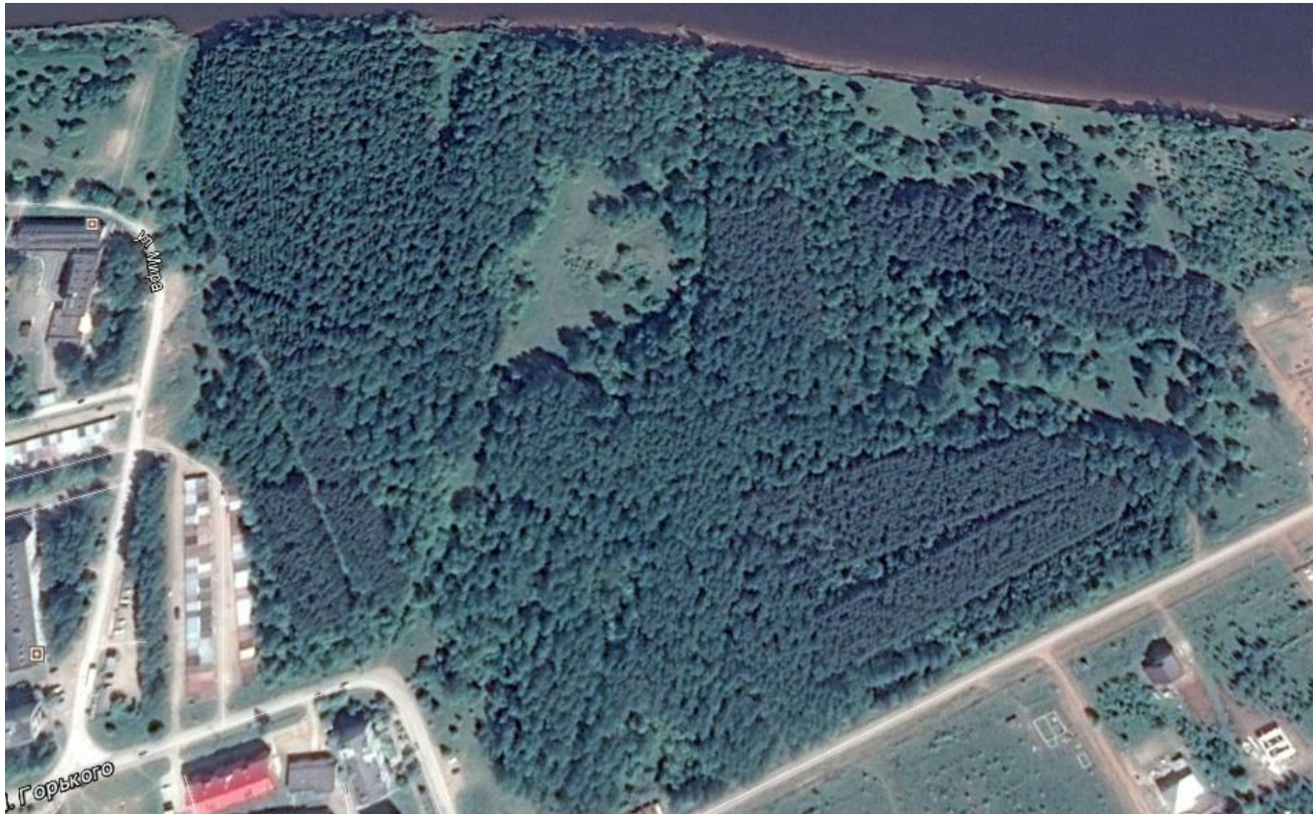
Рис 1. Спутниковая фотография парка .