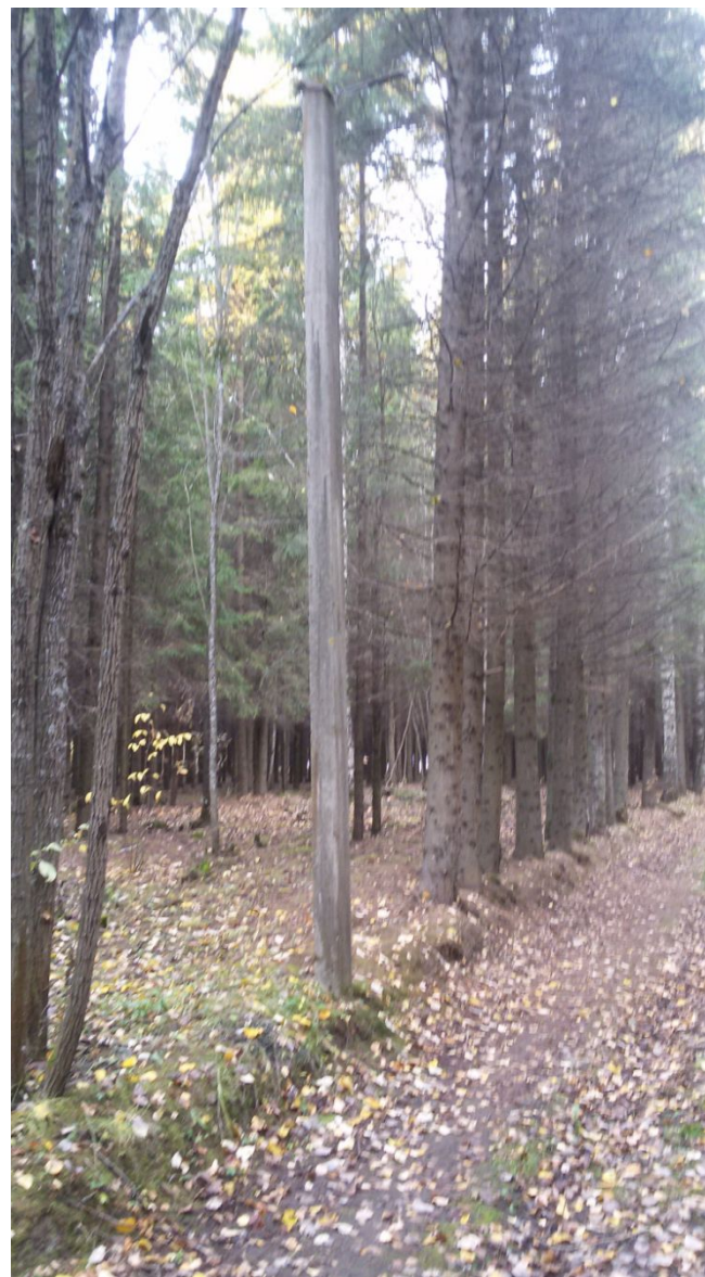
Рис 4. Пример расположения опор относительно деревьев