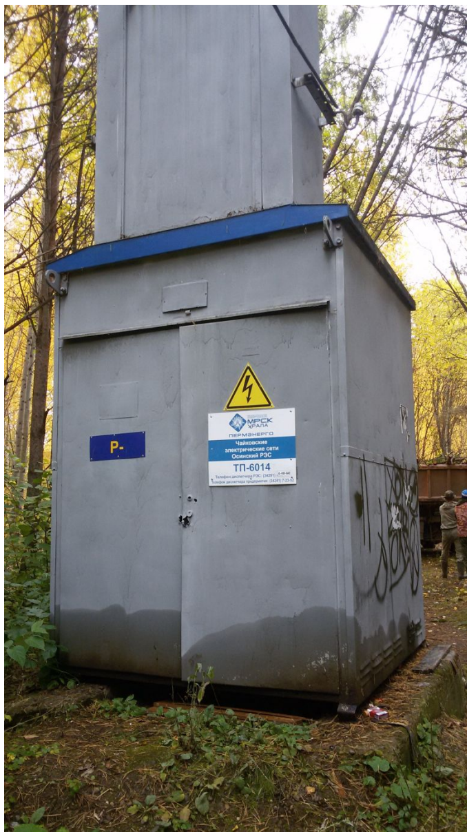
Рис 3. ТП-6014.