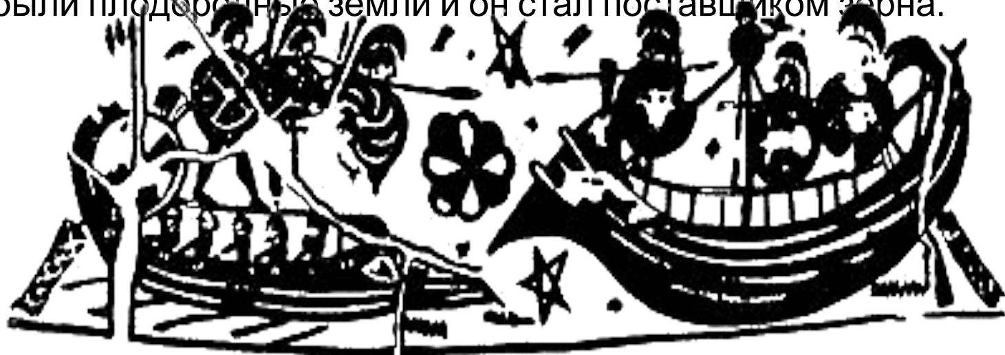
Морской бой. Вазопись