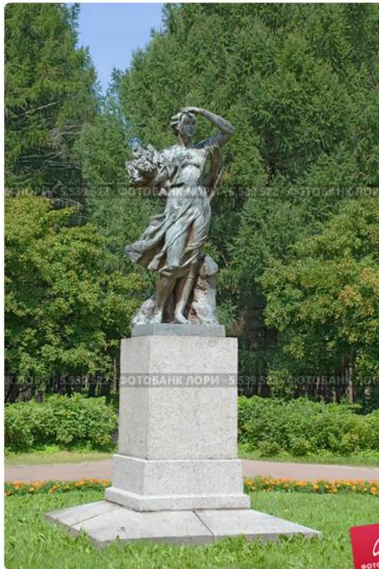
Девушка с букетом цветов. Скульптура в Приморском парке Победы