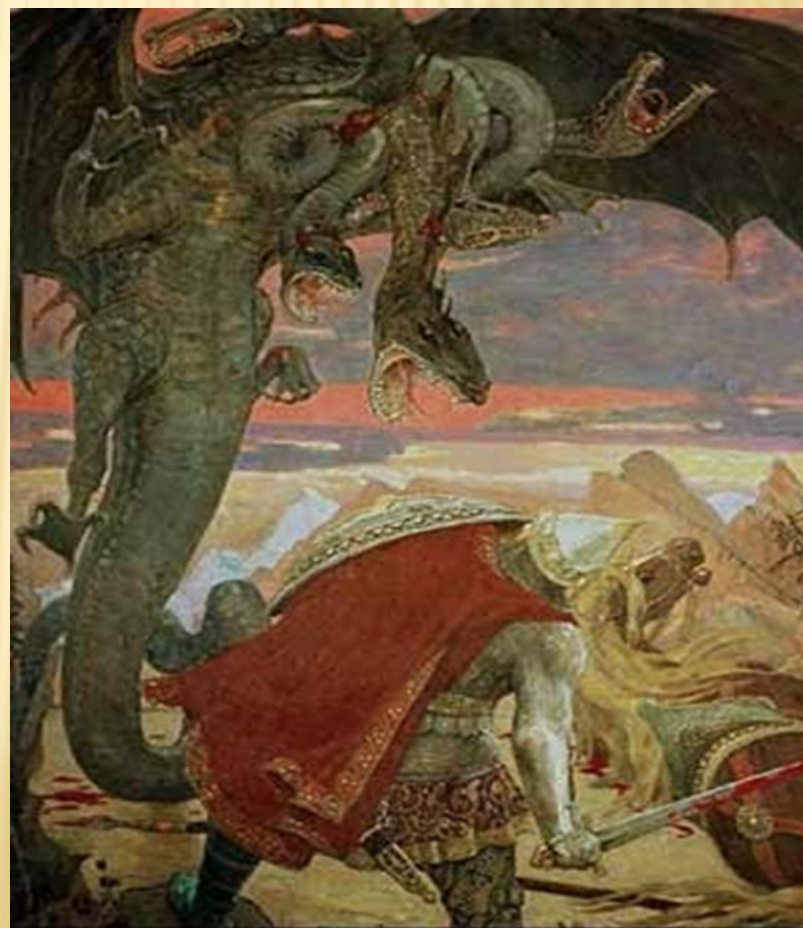
Виктор Васнецов «Бой Добрыни Никитича с семиглавым Змеем Горынычем»

Другим любимым героем народа был богатырь Добрыня Никитич, победивший Змея на Ручей-реке.