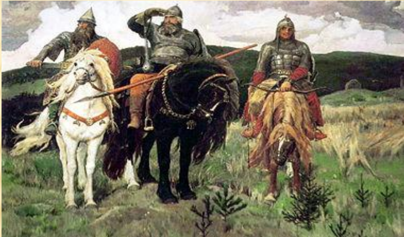
В. М. Васнецов "Богатыри"

В мирные дни русский человек был крестьянином, пахарем, сеятелем, кормильцем. А в дни лихолетья становился воином, защитником. Образ защитника земли русской воспет в былинах, это образ русских богатырей. Былины повествуют о мужественной борьбе русских людей против врагов – кочевников.