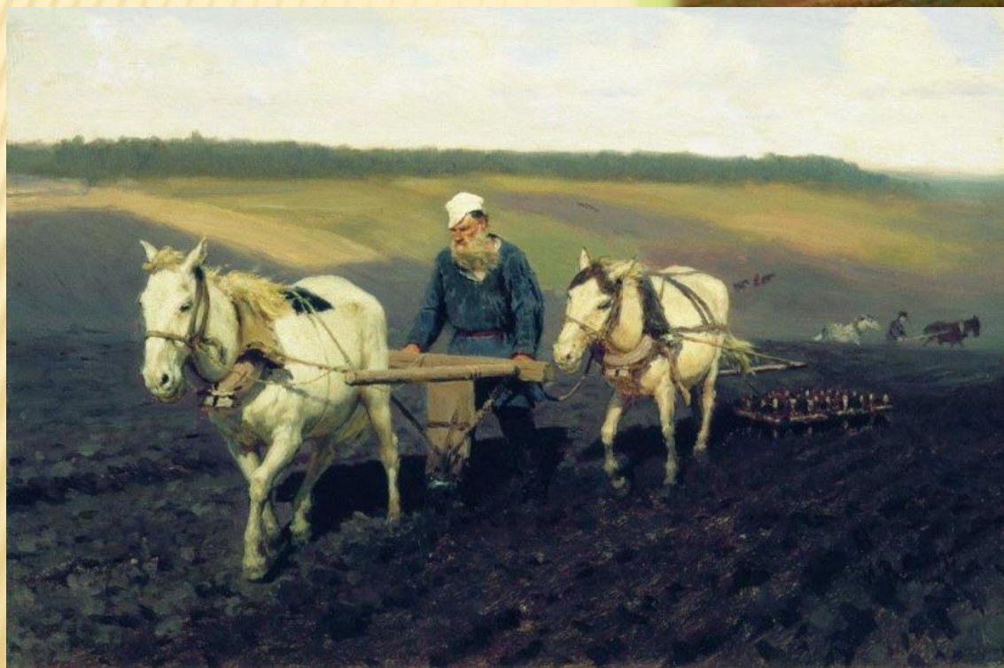
И. Репин. Пахарь . Л. Н. Толстой на пашне