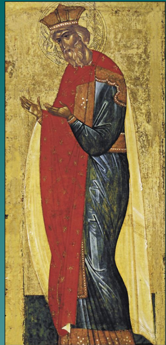
Великий князь Владимир. Икона