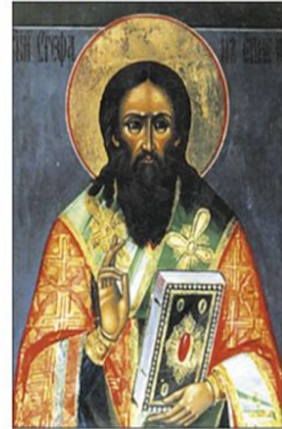
Святитель Стефан Пермский

Плодом его деятельности стало обращение всей обширной Пермской земли к христианству. Для просвещения зырян Стефан составил азбуку их языка и перевёл на него несколько книг. Для утверждения в вере новообращённых, святитель Стефан при храмах открывал училища, где священные книги изучались на зырянском языке.