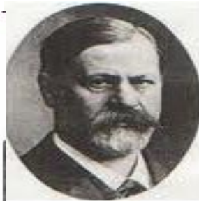
Sigmund Freud (1856 - 1939)