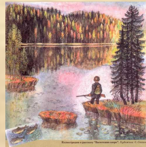
Иллюстрация к рассказу "Валютный зверь", Хрущев С. С. Сказки