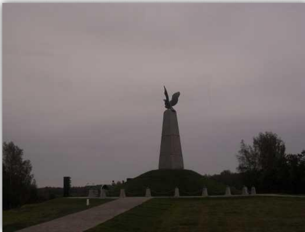
Памятник «Мёртвым великой армии» на Шевардинском редуте

Бородинское сражение ознаменовало собой кризис французской стратегии решающего генерального сражения. Французам в ходе сражения не удалось уничтожить русскую армию, вынудить капитулировать Россию и продиктовать условия мира. Русские же войска нанесли существенный урон армии противника и смогли сохранить силы для грядущих сражений.