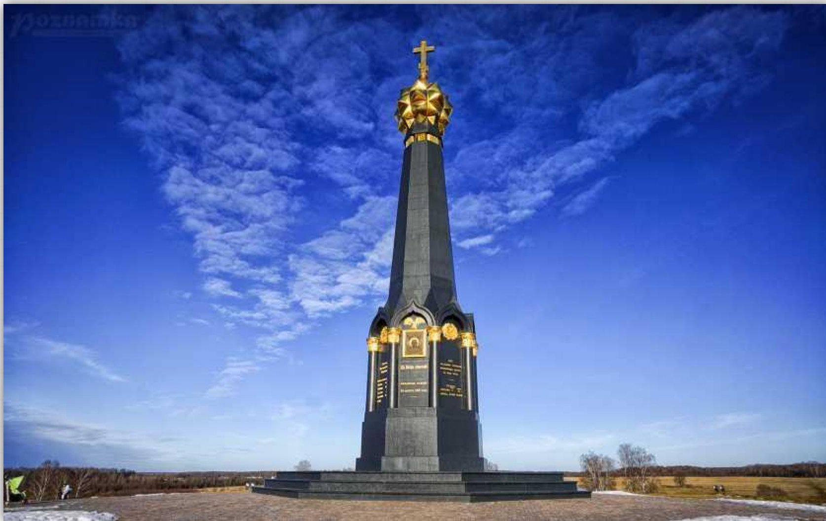
Бородинское поле. Бородинский военно-исторический музей-заповедник.