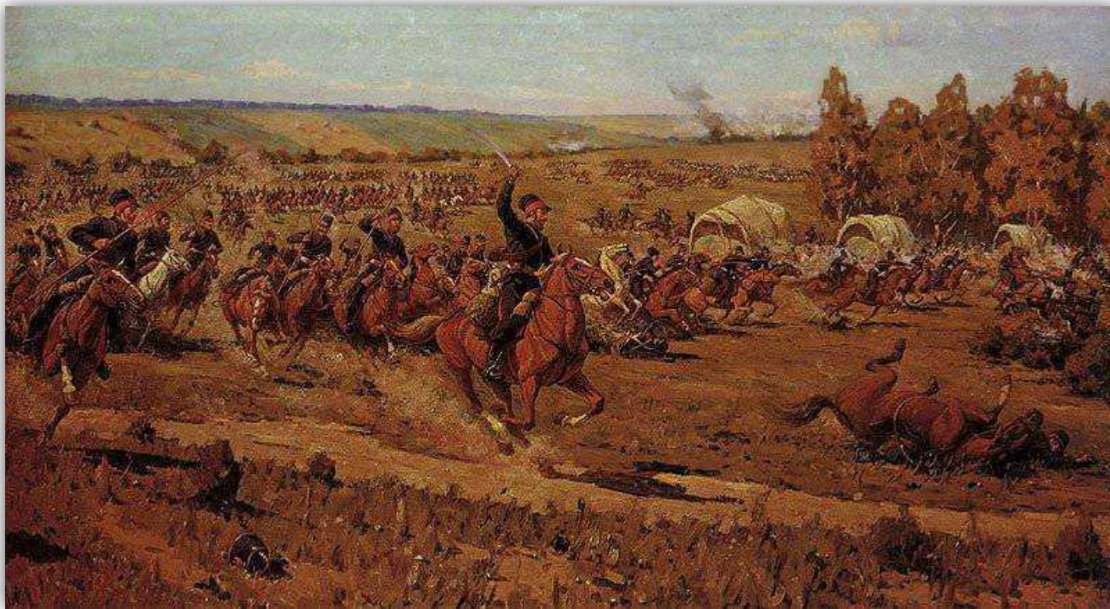
Рейд казаков Платова в тыл наполеоновской армии. Художник Зеликман. 1959 г.