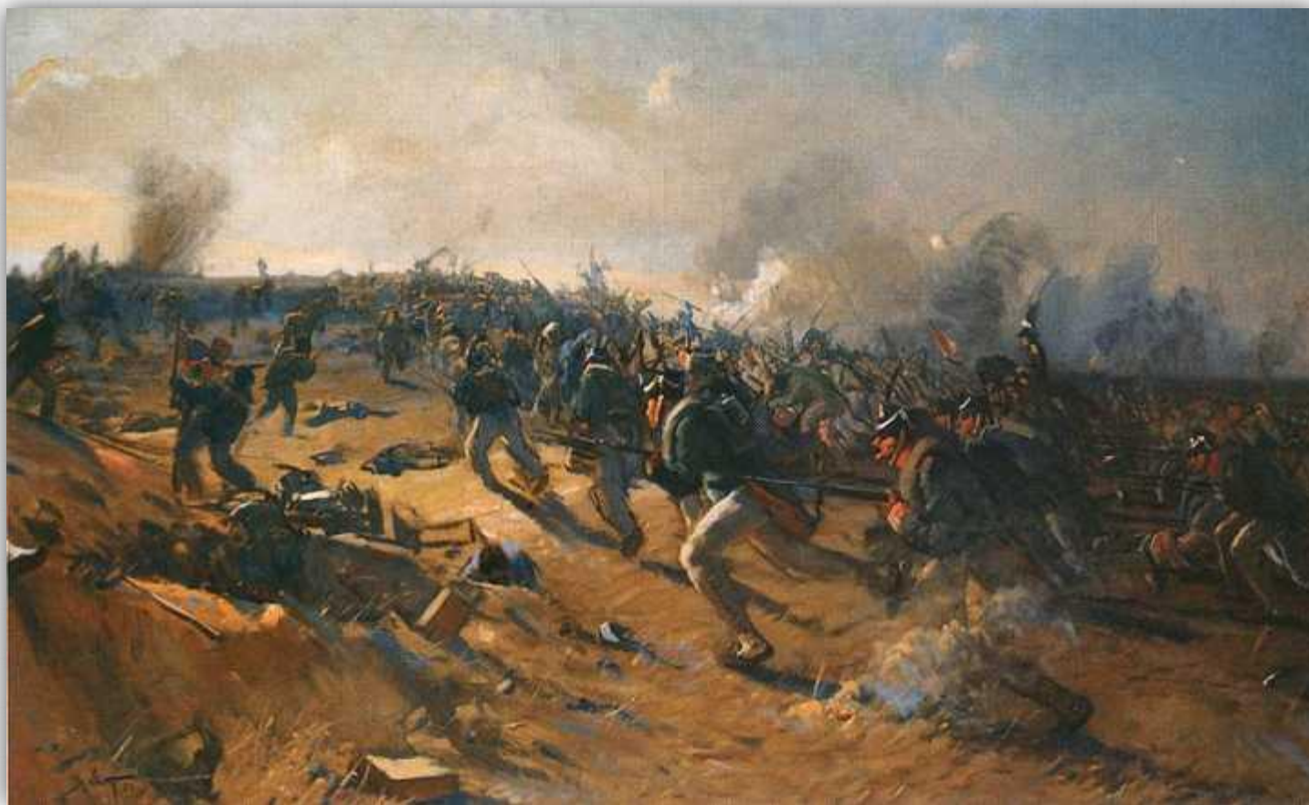
2-я гренадерская дивизия отбивает Шевардинский редут. Художник И.В. Евстигнеев. 1956 г. Холст, масло. 90x150. Музей-заповедник «Бородинское поле».

Самому генеральному сражению предшествовала схватка за Шевардинский редут, продолжавшаяся весь день 24 августа.