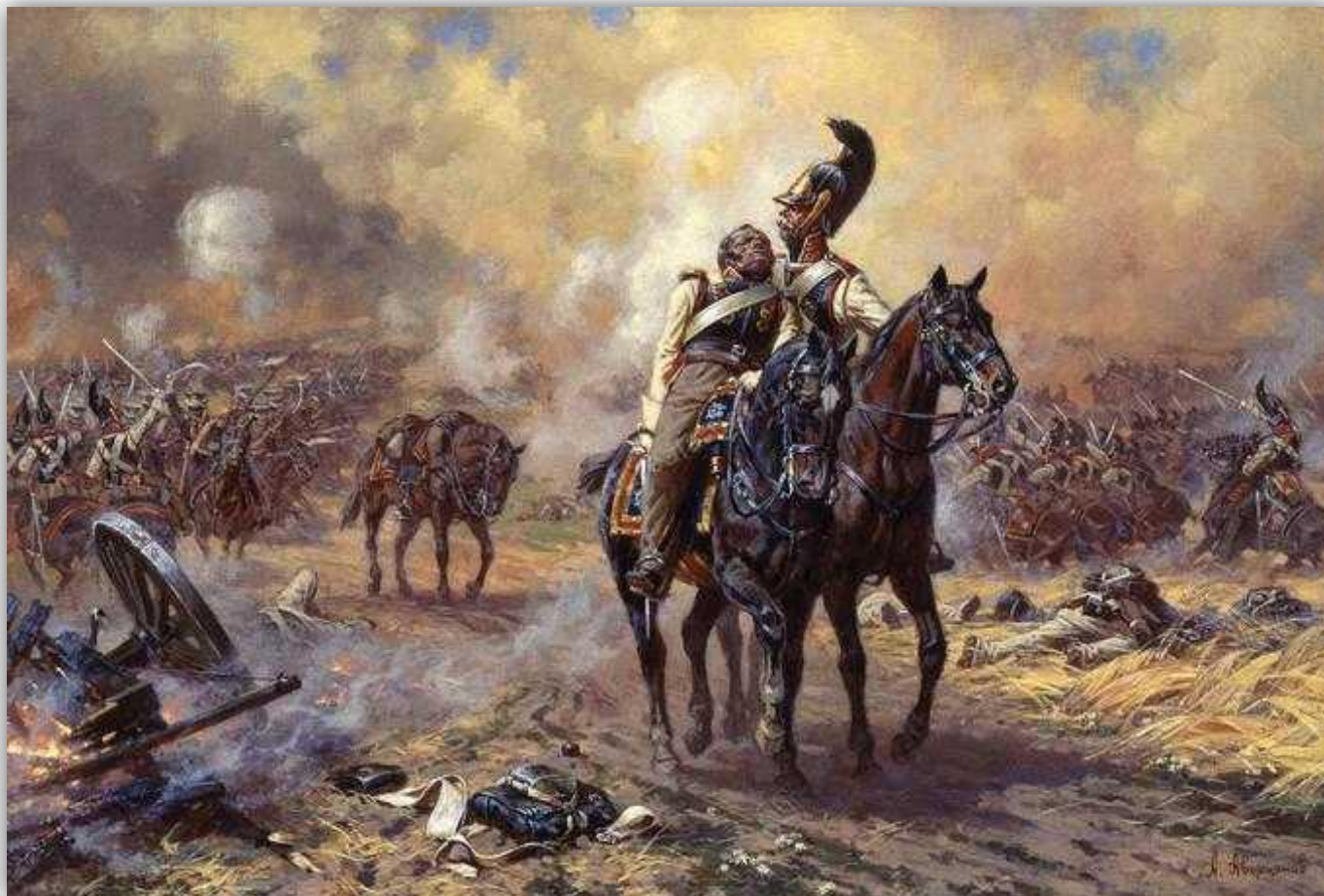
Конюводы на Бородинском поле. Александр Аверьянов, 2003

Само Бородинское сражение складывалась из нескольких кровопролитных сражений.