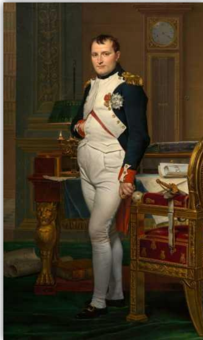
Портрет Наполеона в кабинете дворца Тюильри. Художник Жак-Луи Давид, 1812.