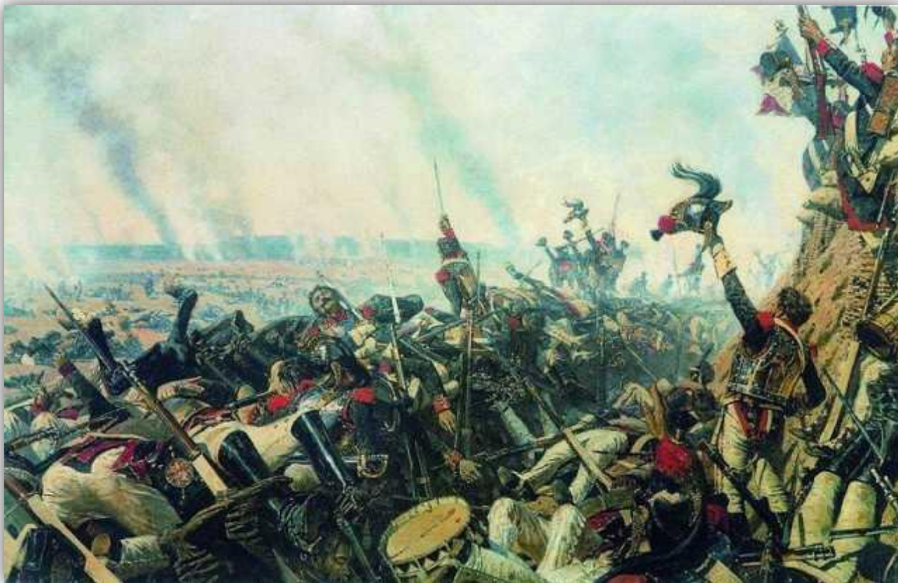
Конец Бородинского боя. В.В. Верещагин (около 1899)

И хотя французами были захвачены все ключевые позиции, к вечеру 26 августа, они были вынуждены отступить и оставить территории русским. Но, Кутузов, понимая, что у него осталось чуть больше половины первоначального количества людей (кстати, французы потеряли еще больше – почти 60 тысяч человек), принял решение отступить к Москве.