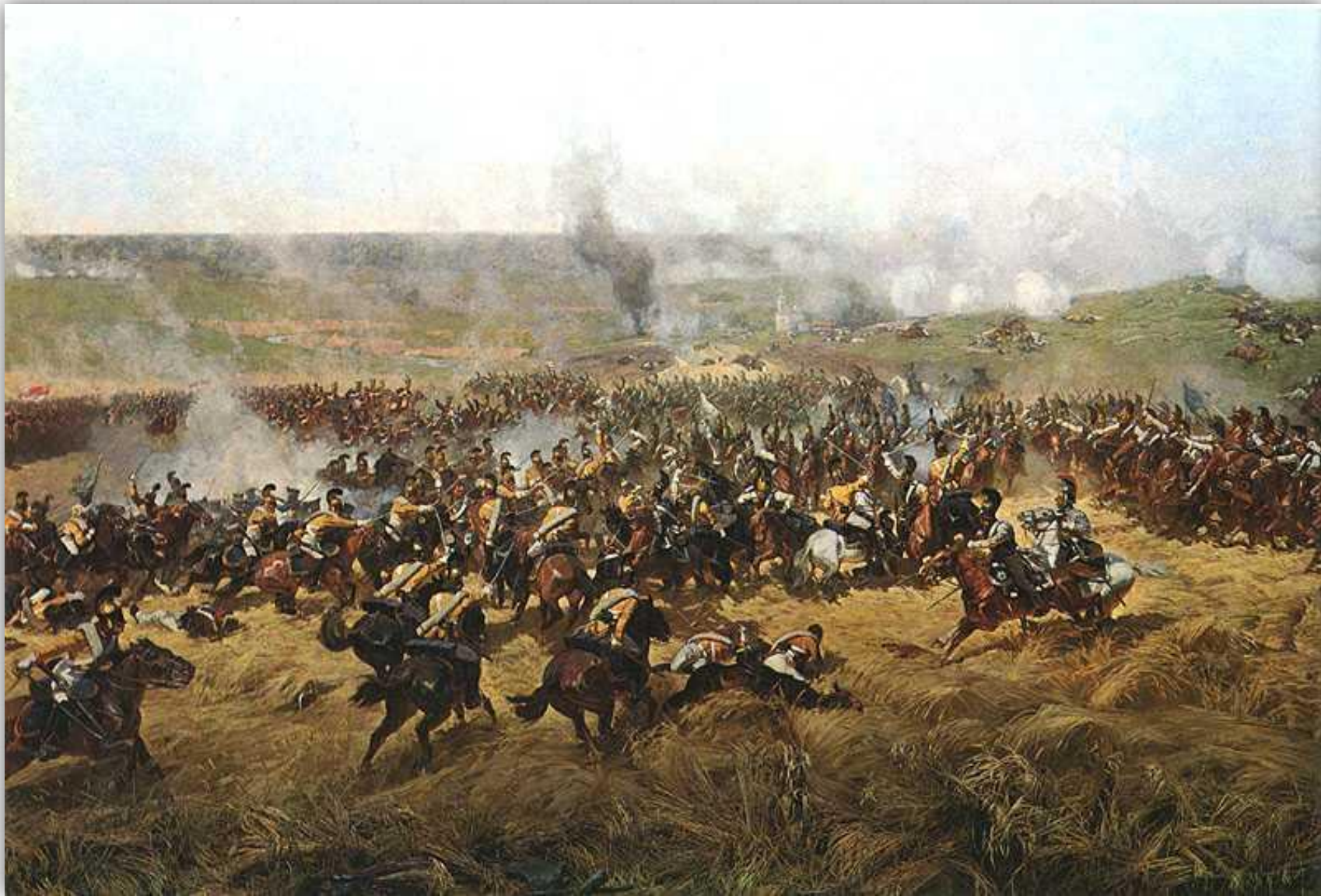
Бородинское сражение в 12:30. Саксонские кирасиры и польские уланы сталкиваются с русскими кирасирами. Справа - батарея Раевского, на заднем фоне церковь. Франц Рубо, 1912