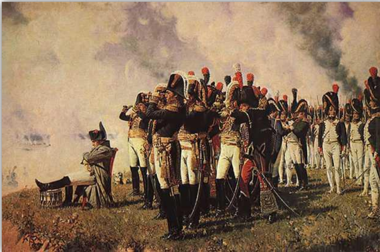
Наполеон на Бородинских высотах. В.В. Верещагин, 1897

Наполеону, к 1812 году, покорилась почти вся Европа. Он использовал оставшуюся военную мощь покоренных ему народов и собрал огромную армию (приблизительно 600 тысяч человек), для наступления на Россию и в дальнейшем для ее захвата. Численность Российской армии, была втрое меньше армии французского императора.