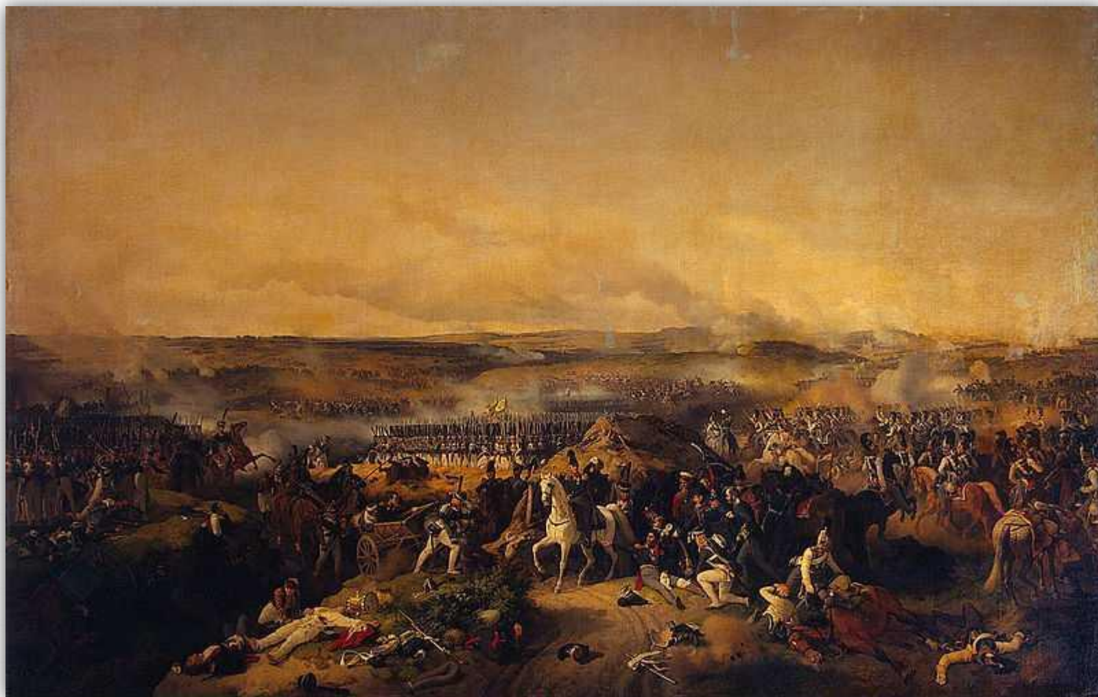
Бородинское сражение. В центре картины раненый генерал Багратион, рядом с ним на коне генерал Коновницын. Вдали виднеется каре лейб-гвардии. Художник П. Гесс, 1843 г.