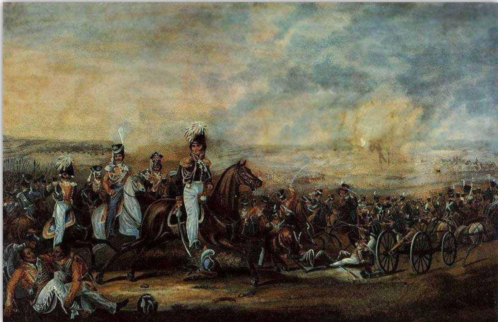
Кавалерийская атака генерала Ф. П. Уварова. Раскрашенная литография С. Васильева по оригиналу А. Дезарно. 1-я четверть XIX в.