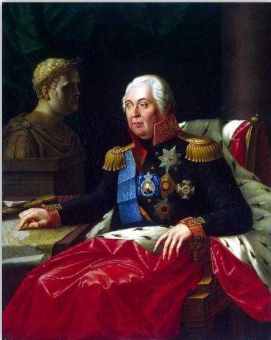
Портрет Михаила Илларионовича Кутузова. Художник Олешкевич Иосиф Иванович