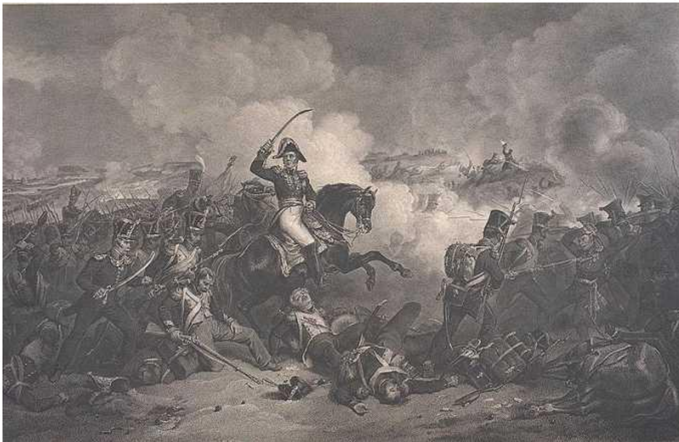
Атака маршала Нея при Бородине. Гравюра по картине Ланглуа, 19 в.

Схватка за Багратионовы флеши, в которой против двух дивизий под командованием Неверовского и Воронцова были выдвинуты 15 дивизий маршалов Нея, Даву, Мюрата и генерала Жюно. Именно здесь был ранен Багратион и командование принял генерал Коновницын.