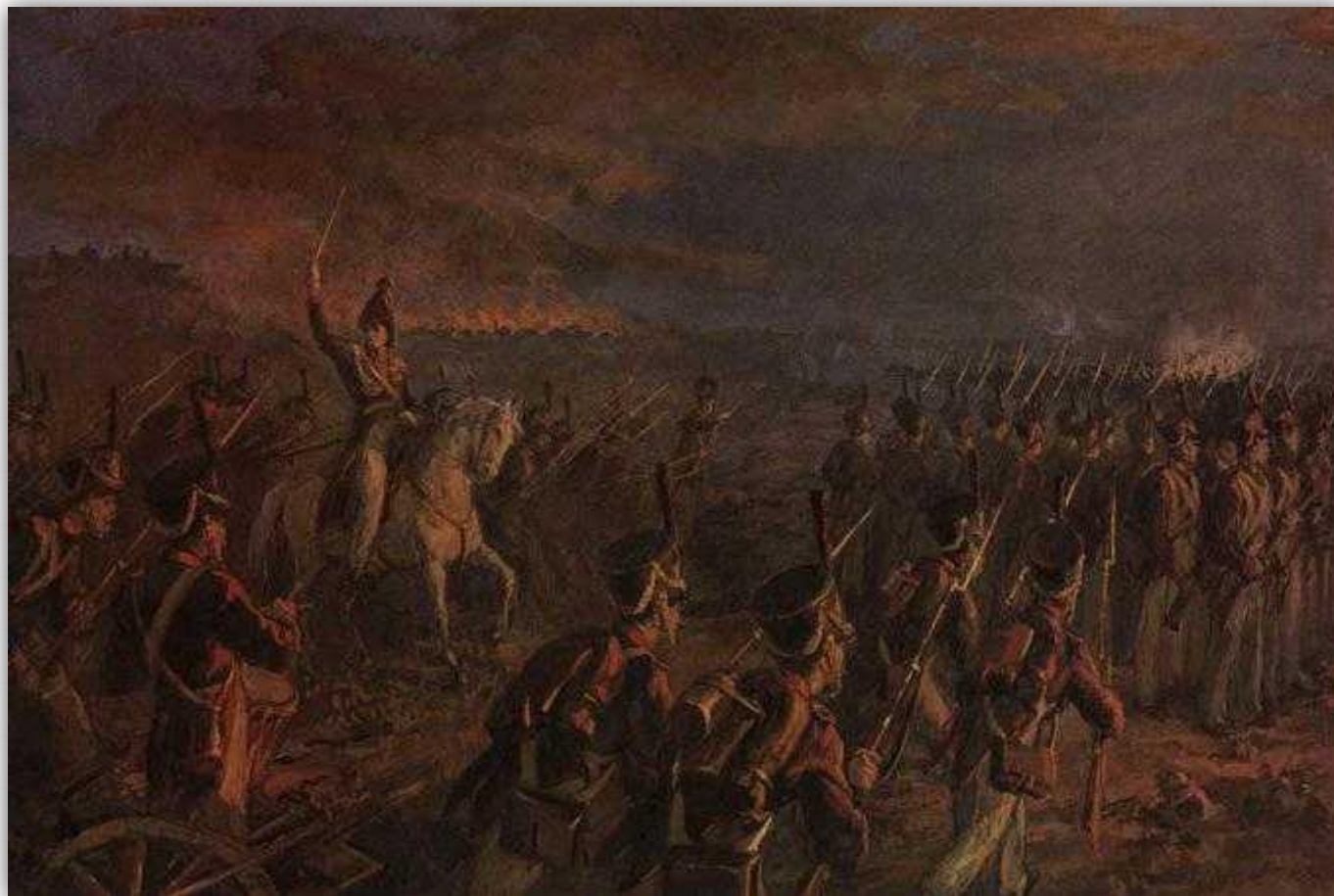
Подвиг солдат генерала Горчакова. Художник Ю. Цыганков. 1955 г.

За этот день редут поочередно переходил то к одной стороне то к другой, но вечером Кутузов приказал войскам Горчакова, оборонявшим редут, отходить к основным силам.