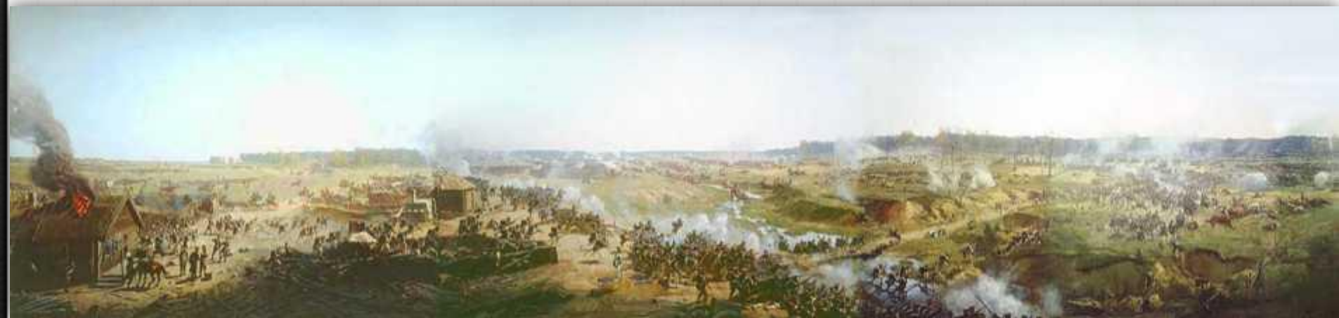
Бой за Семёновский овраг. Фрагмент панорамы Бородинского сражения. Рубо (1912)

После того как русские оставили флеши и закрепились за Семеновским оврагом, здесь произошла третья схватка, в ней участвовали войска, нападавшие на флеши и оборонявшие их. К французам присоединилась тяжелая конница генерала Нансути, к русским войскам подтянулись казаки Платова и кавалерия Уварова.