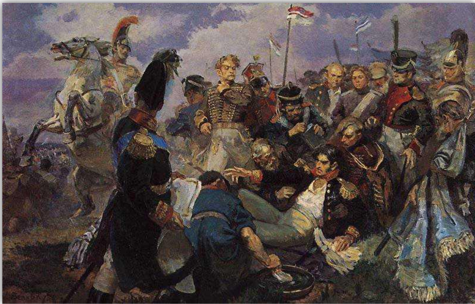
Смертельное ранение генерала Багратиона на Бородинском поле. Художник А. Вепхадзе. 1948 г.