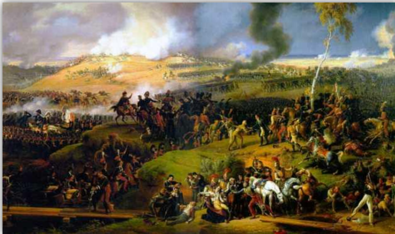
Бородинское сражение. Louis Lejeune, 1822

Бородинское сражение, или Бородинская битва (во французской истории — битва у Москвы-реки), — крупнейшее сражение Отечественной войны 1812 года между русской армией под командованием генерала от инфантерии М. И. Кутузова и французской армией под командованием императора Наполеона I Бонапарта.