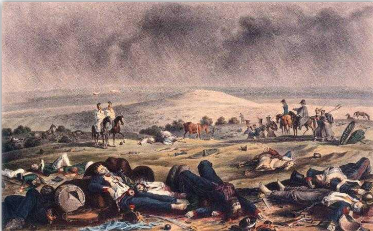
Х. В. Фабер дю Фор «На Бородинском поле, 17 сентября 1812 г.»

Главным достижением генерального сражения при Бородине стало то, что Наполеон не сумел разгромить русскую армию, а в объективных условиях всей Русской кампании 1812 года отсутствие решающей победы предопределило конечное поражение Наполеона.