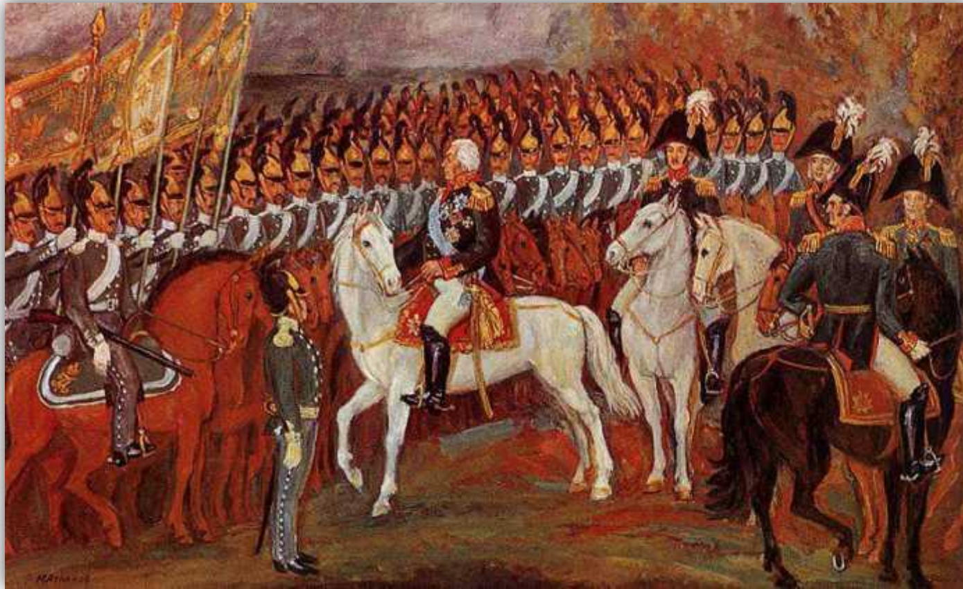
Обращение М. И. Кутузова к войскам накануне Бородинского сражения. Художник Ю. Атланов. 1982 г.

Основной причиной, по которой русские войска дали бой при Бородино, было желание ослабить французскую армию и задержать ее продвижение к Москве. Для этого Кутузов перекрыл Новую Смоленскую дорогу, где наступали французы, сосредоточив на этом участке почти три четверти сил.