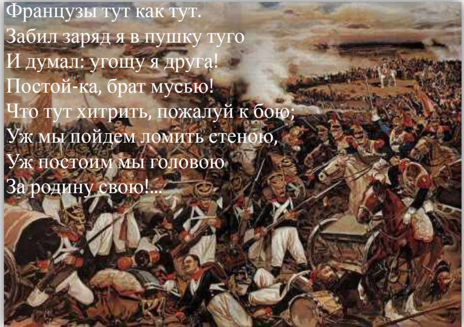
Эпизод Бородинского сражения. Иллюстрация к стихотворению М. Ю. Лермонтова «Бородино». Хромолитография Н. Богатова.