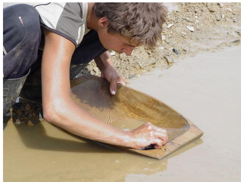
ДОБЫЧА ЗОЛОТА КУСТАРНЫМ СПОСОБОМ

3. Уровень квалификации работника (в условиях НТР стоимость рабочей силы растет, а значит и рост заработной платы квалифицированных работников)