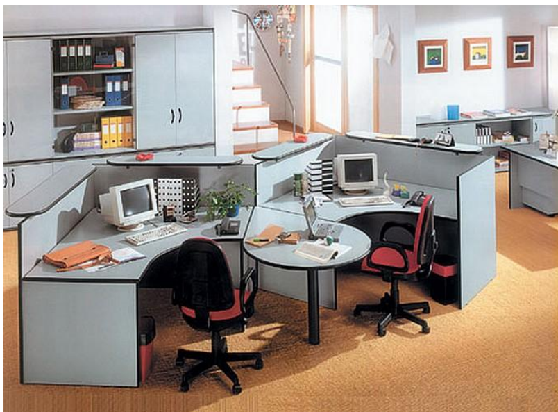
ОФИС В США