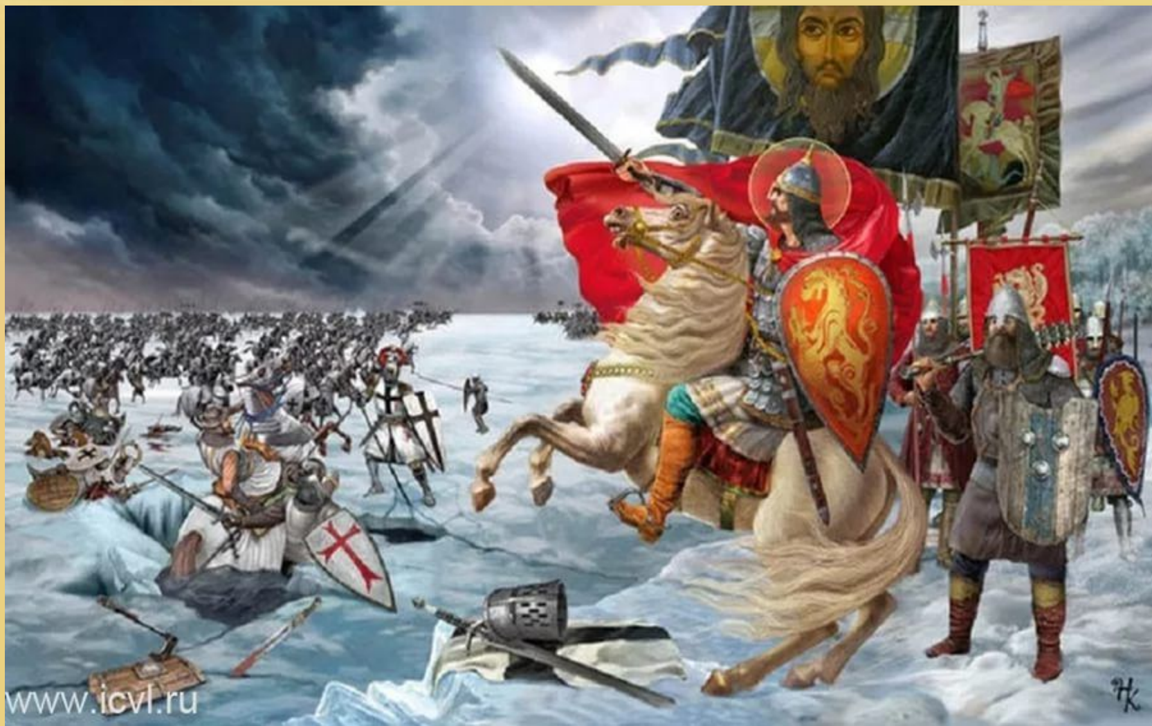
Ледовое побоище на Чудском озере, 5 апреля 1242 г., Александр Невский.