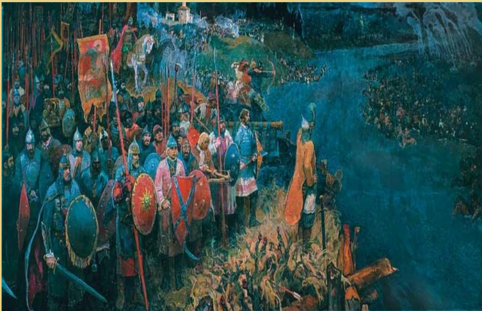
Битва на реке Угре, в 1480 году, московский князь Иван III