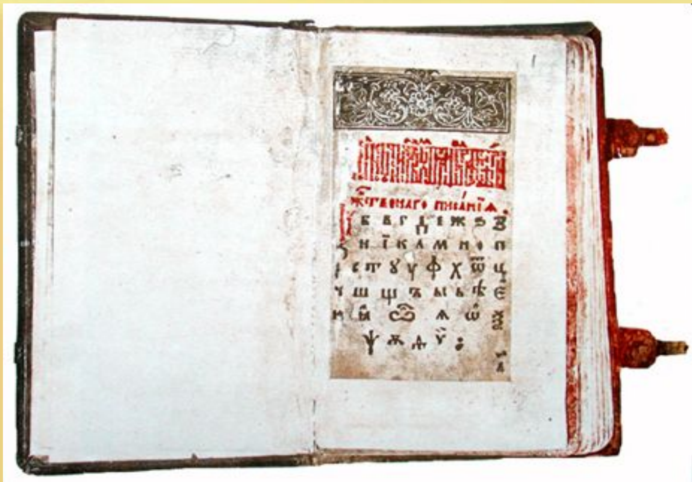
Букварь Василия Бурцова (1637г)