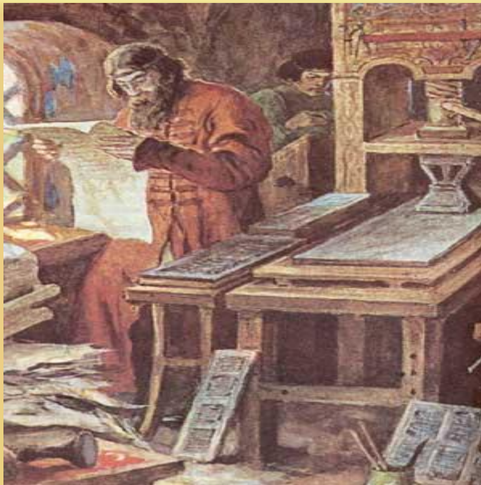
Иван Фёдоров (Московитин Иван Фёдорович)