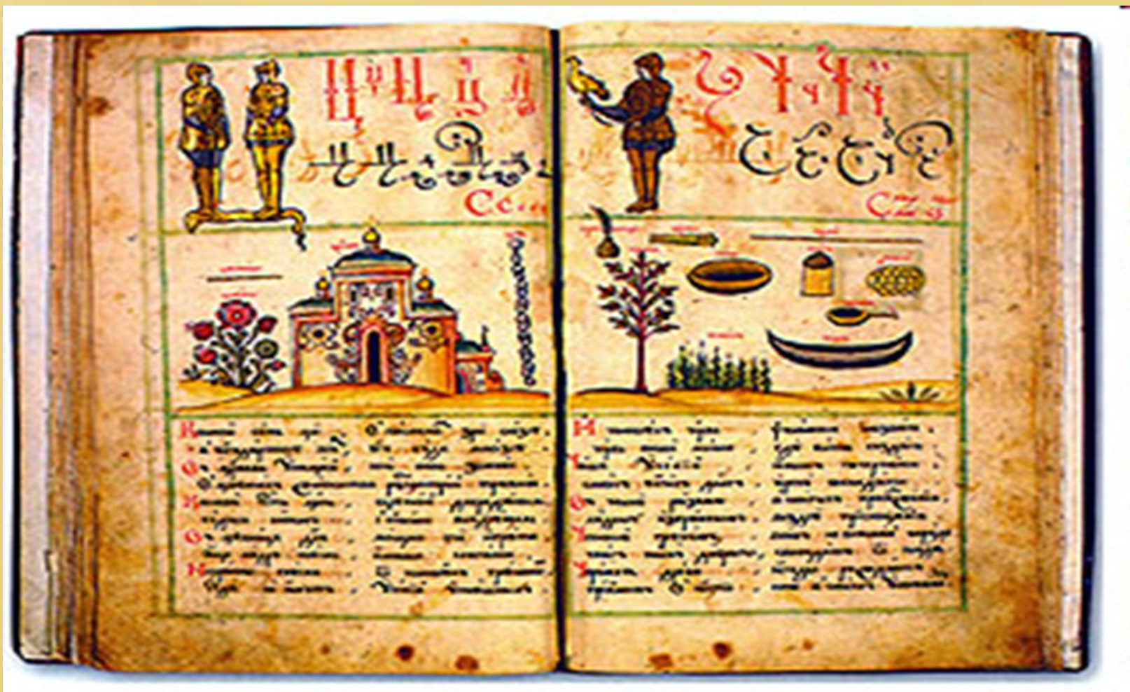
Букварь Кариона Истомина