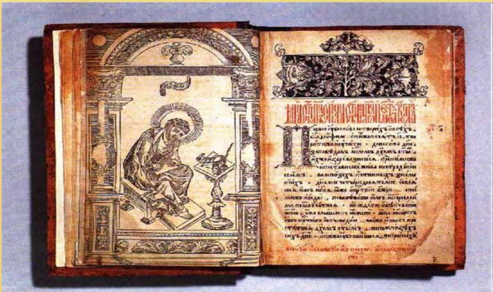
Первая русская печатная книга "Апостол"