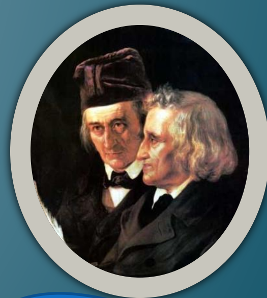
Братья Гримм 1785-1863 1786-1859