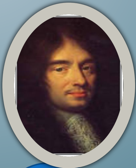
Шарль Перро 1628-1703