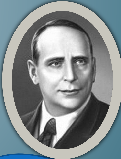
Евгений Шварц 1896-1958