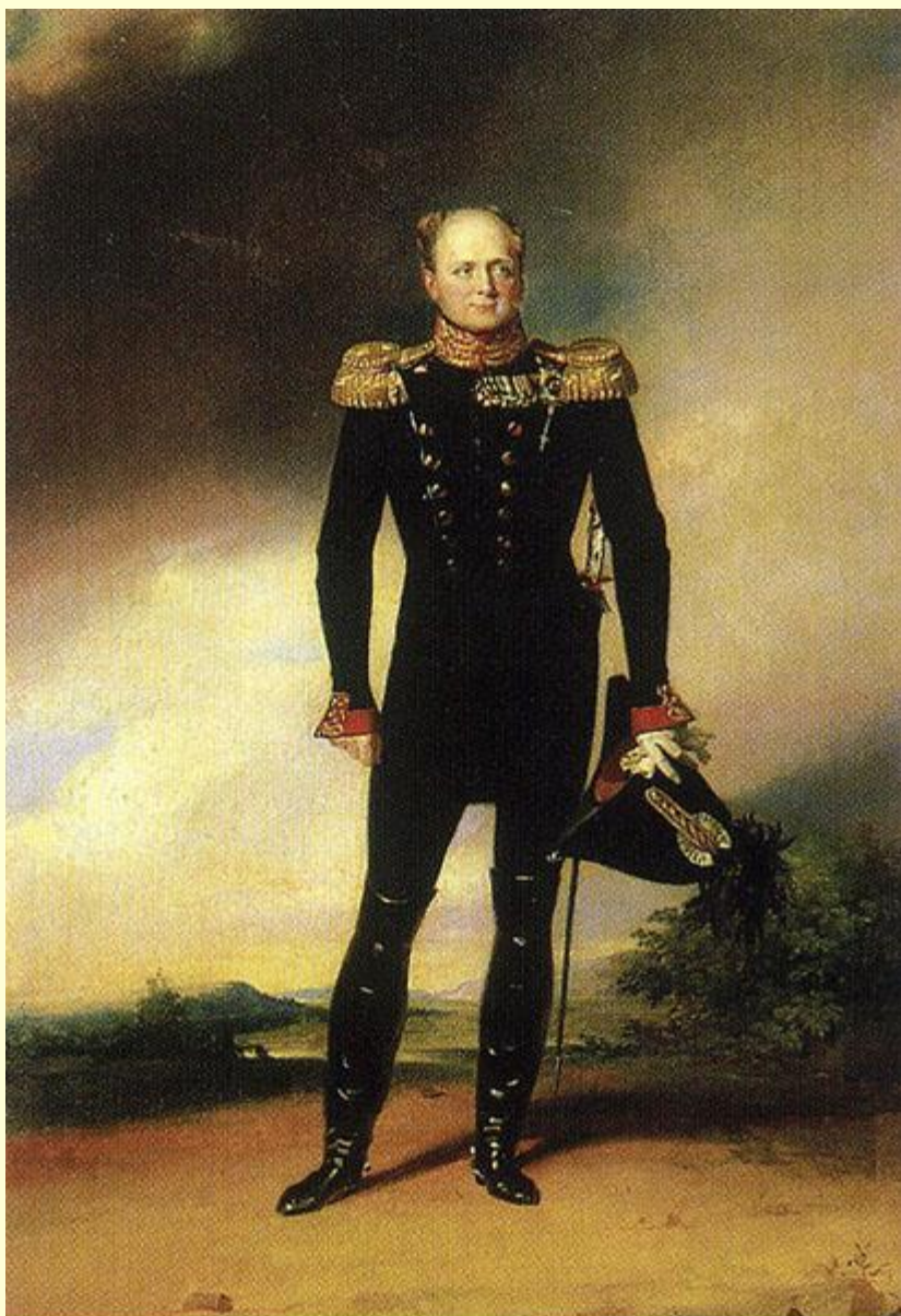
Доу Дж. Портрет императора Александра I.