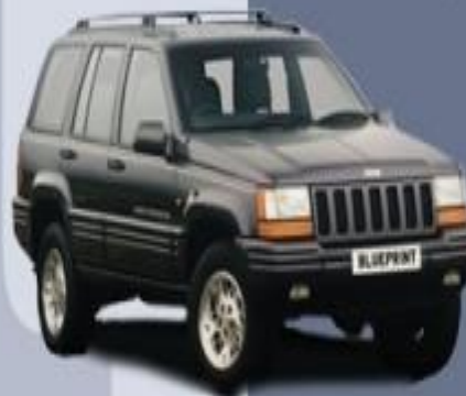
96' Jeep Grand Cherokee (3964 см³)