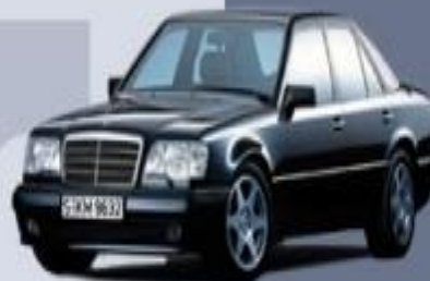
93' Mercedes-Benz E320 (3199 см³)