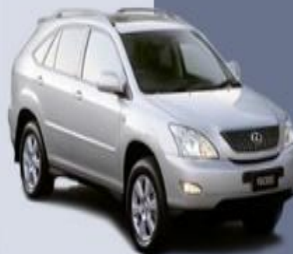
04' Lexus RX330 (3310 см³)