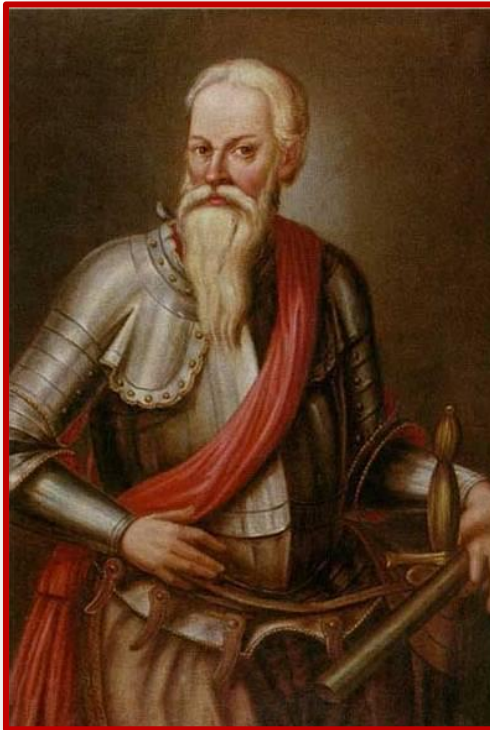
Николай Радзивилл Рыжий