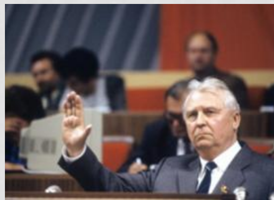
Е. К. Лигачёв