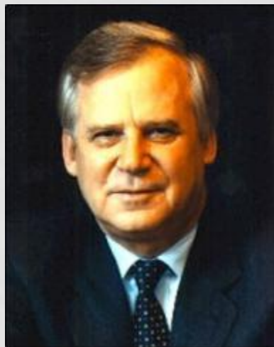
Н. И. Рыжков