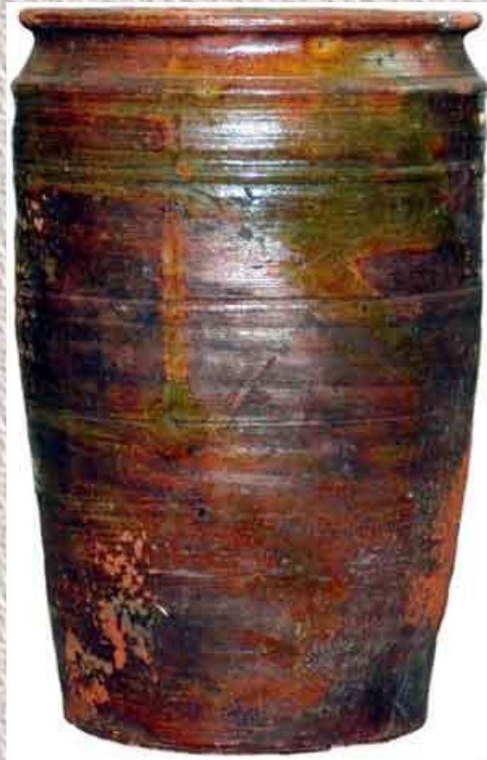
Крупник (или пудовик) - ёмкость для хранения сыпучих продуктов (15-16 кг.) .