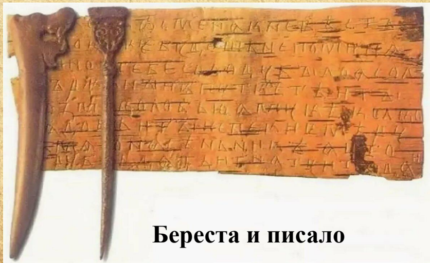
Береста и писало