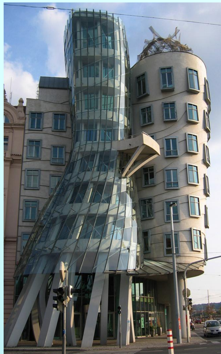
«Танцующий дом», здание Национале Нидерланден в Праге