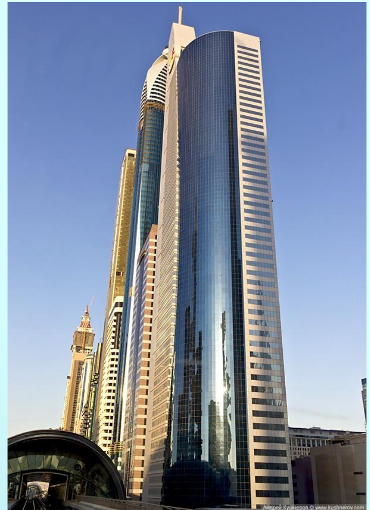
Дубай. Небоскрёбы на шоссе шейха Зайда