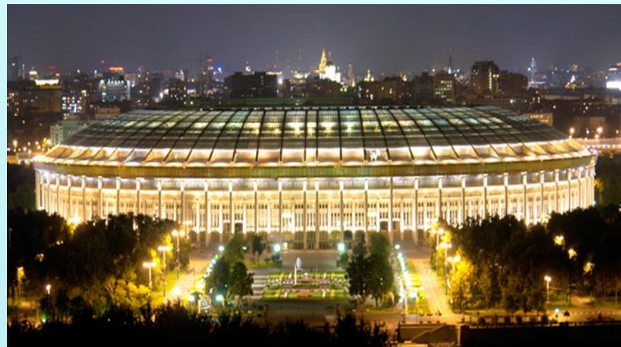
Стадион «Лужники» . Москва