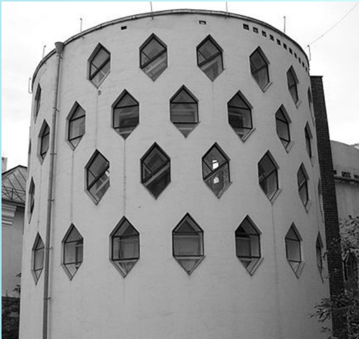
К.С. Мельников. Дом-мастерская автора