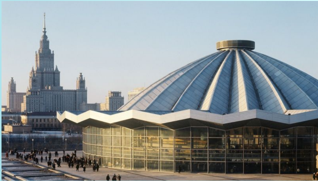
Москва. Цирк на проспекте Вернадского