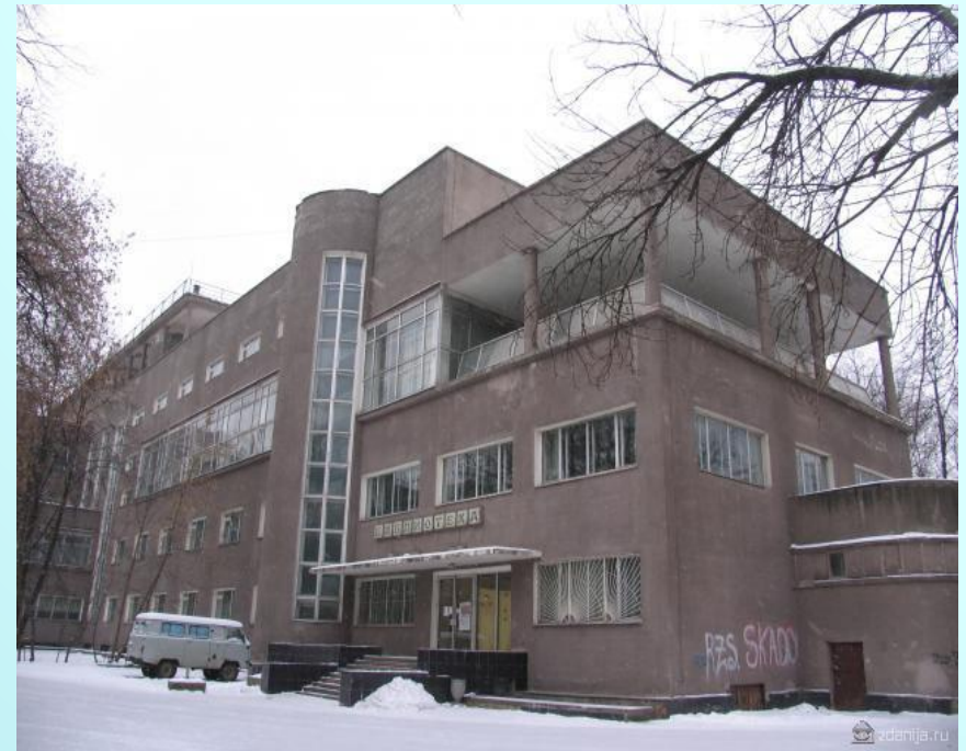
Дворец культуры ЗиЛа. Библиотечное крыло. Москва