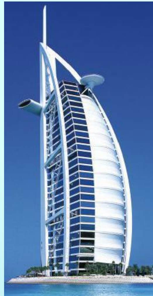
Burj Al Arab (отель Парус) Дубай