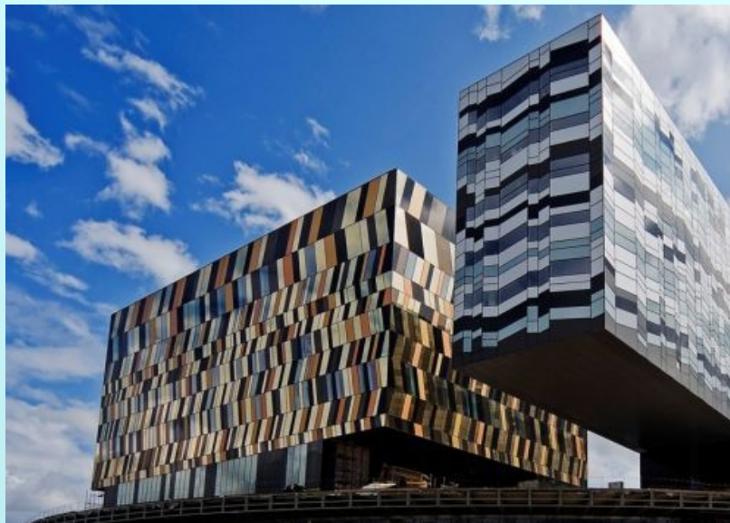
школа управления в Москве