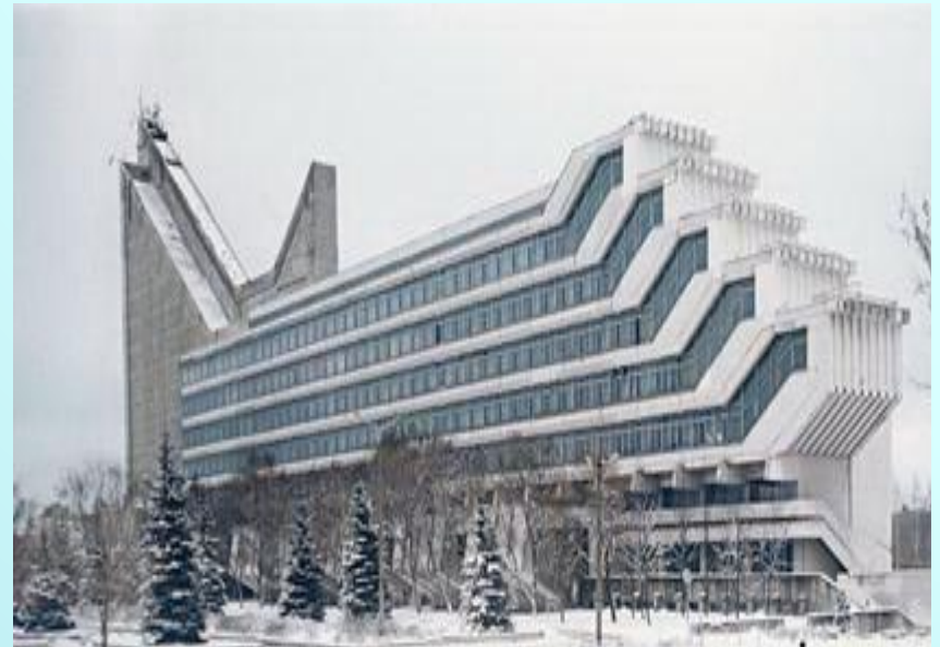
Корпус факультета архитектуры политехнического университета. Минск, Беларусь.