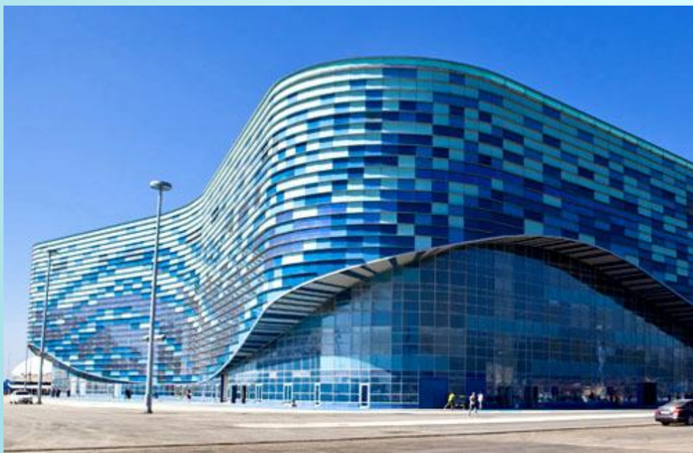
Сочи. Ледовый дворец айсберг

Современные архитекторы обращаются к инновационным технологиям.