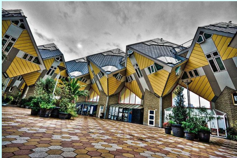
дом в Роттердаме