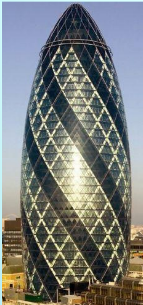
Главный офис страховой компании «Swiss Re», Лондон