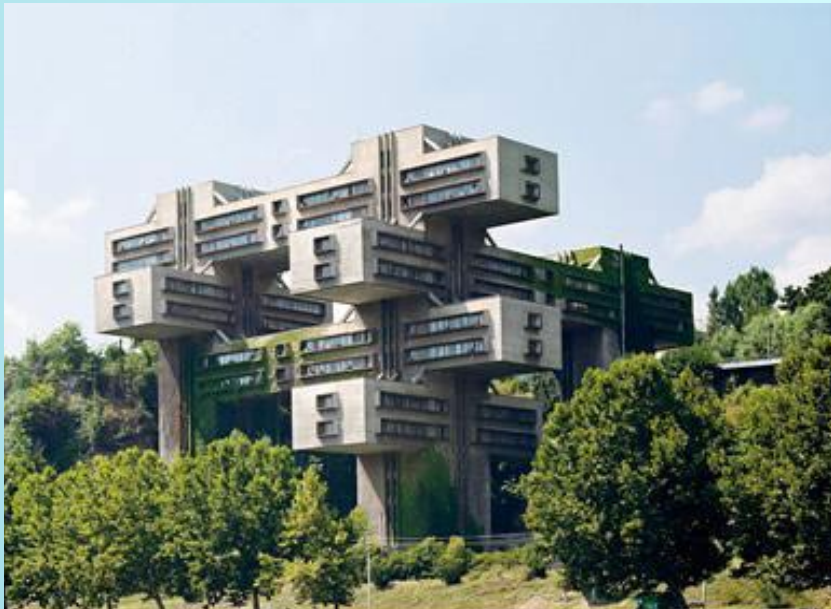
Министерство автомобильных дорог. Тбилиси, Грузия

В XX веке на смену принципам симметрии в архитектуре пришли принципы асимметрии и динамического равновесия