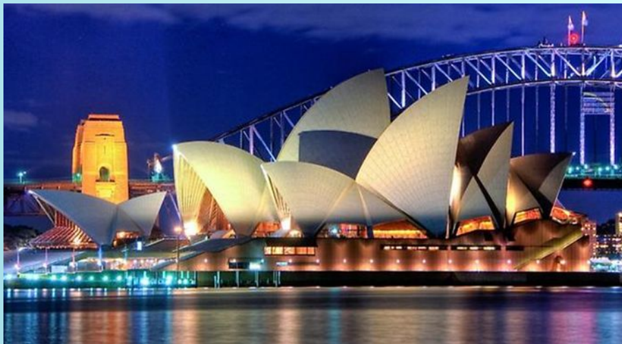
Оперный театр. Сидней

«Форма следует функции» Луи Генри Салливен