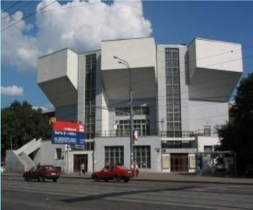
Дом культуры имени И.В. Русакова. Москва