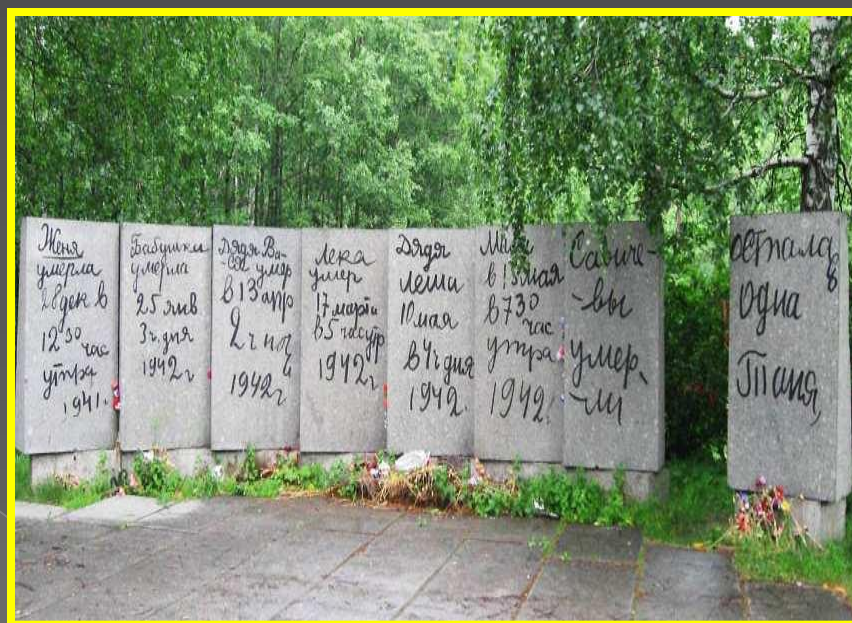
Памятник семье Савичевых

Таня Савичева жила в ленинградской семье. Началась война, затем блокада. На глазах Тани погибли её бабушка, двое дядей, мама, брат и сестра. Когда началась эвакуация детей, девочку удалось вывезти по Дороге Жизни на «Большую землю». Врачи боролись за её жизнь, но медицинская помощь пришла слишком поздно. Таня Савичева умерла от истощения.