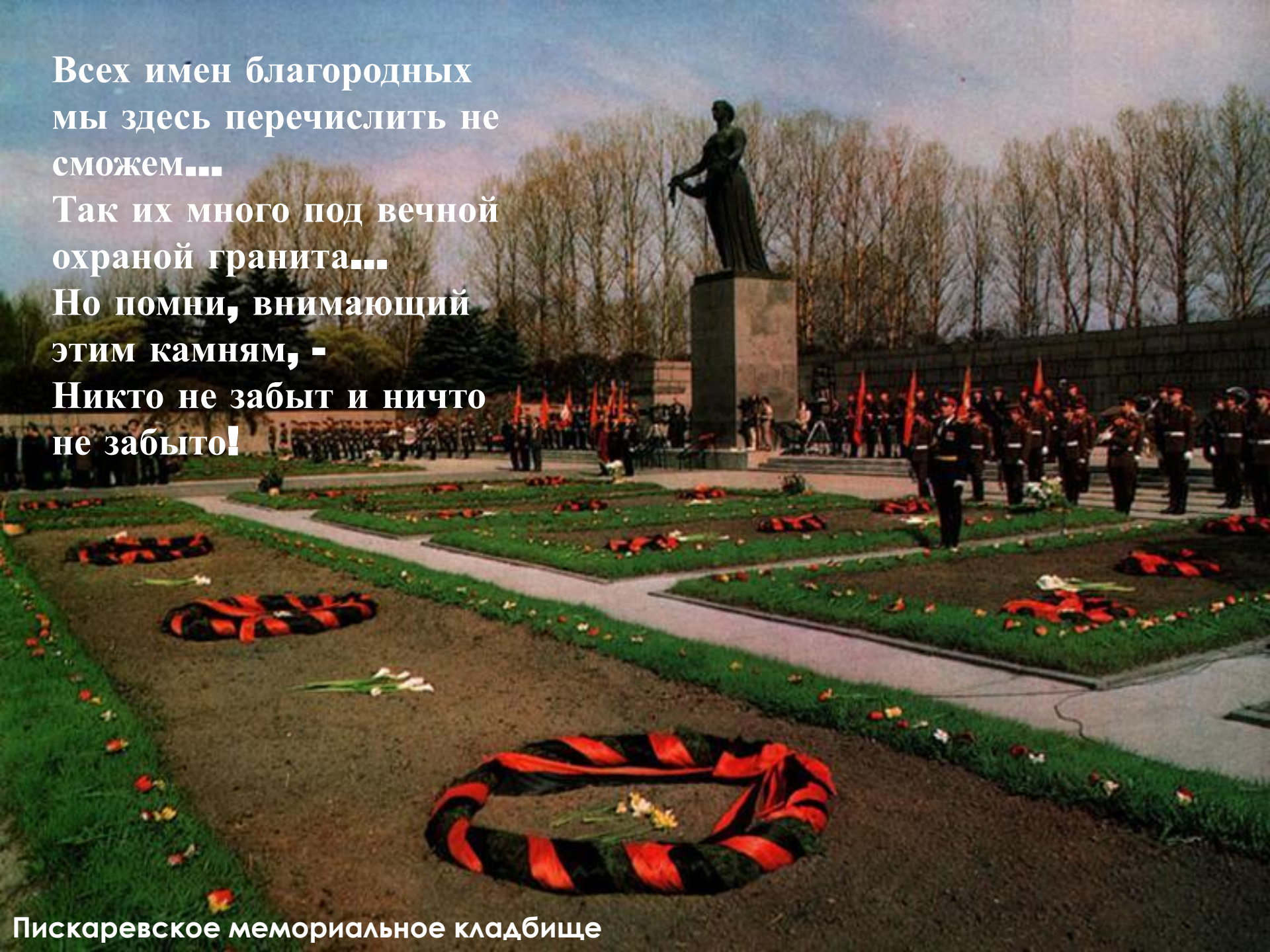
Пискаревское мемориальное кладбище