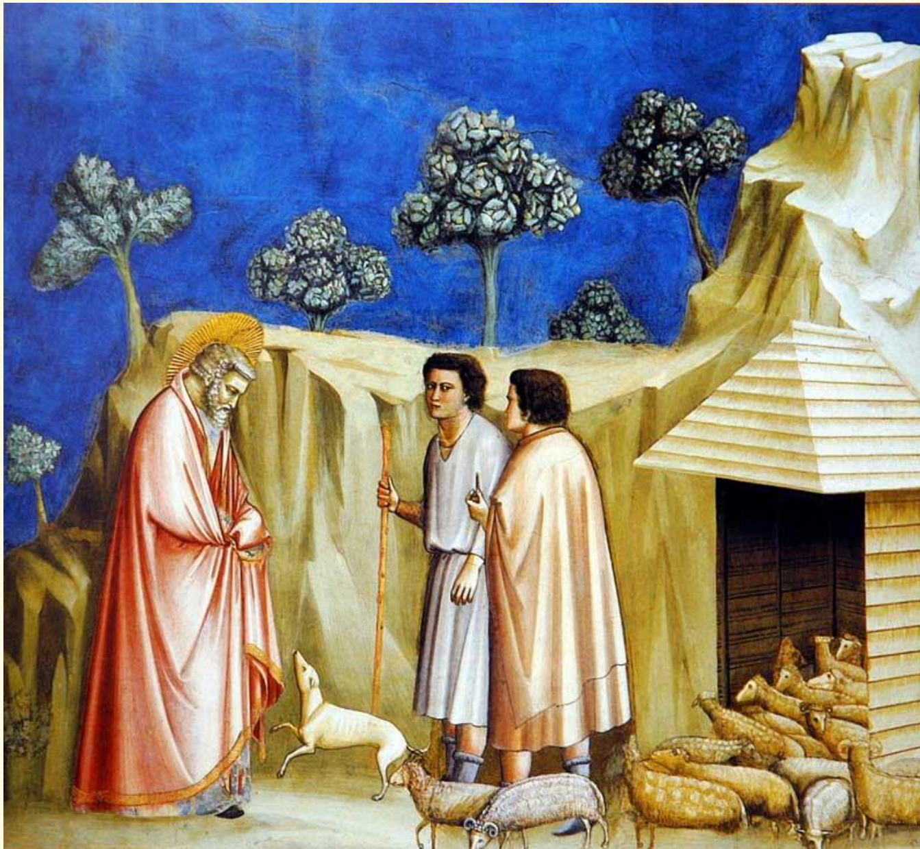
Возвращение Святого Иосифа к пастухам.