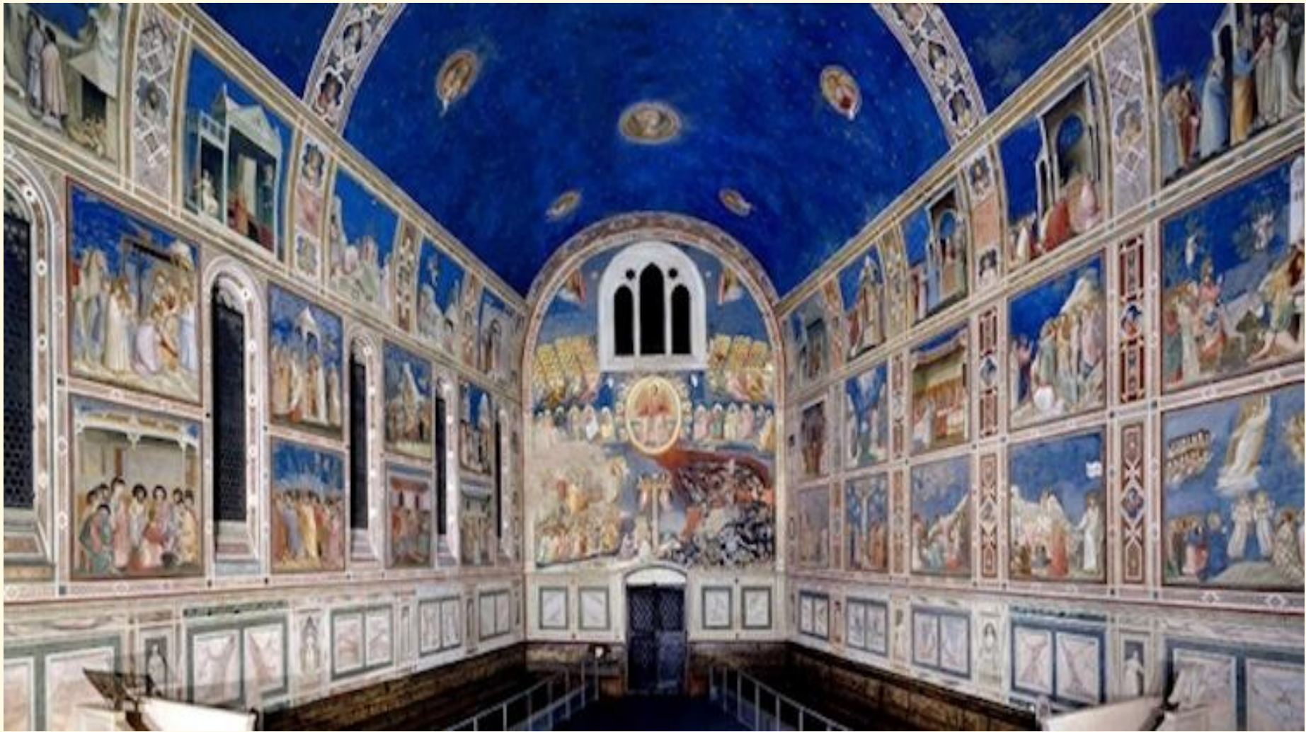
Капелла дель Арена. Вид входа в часовню, торцовая стена.