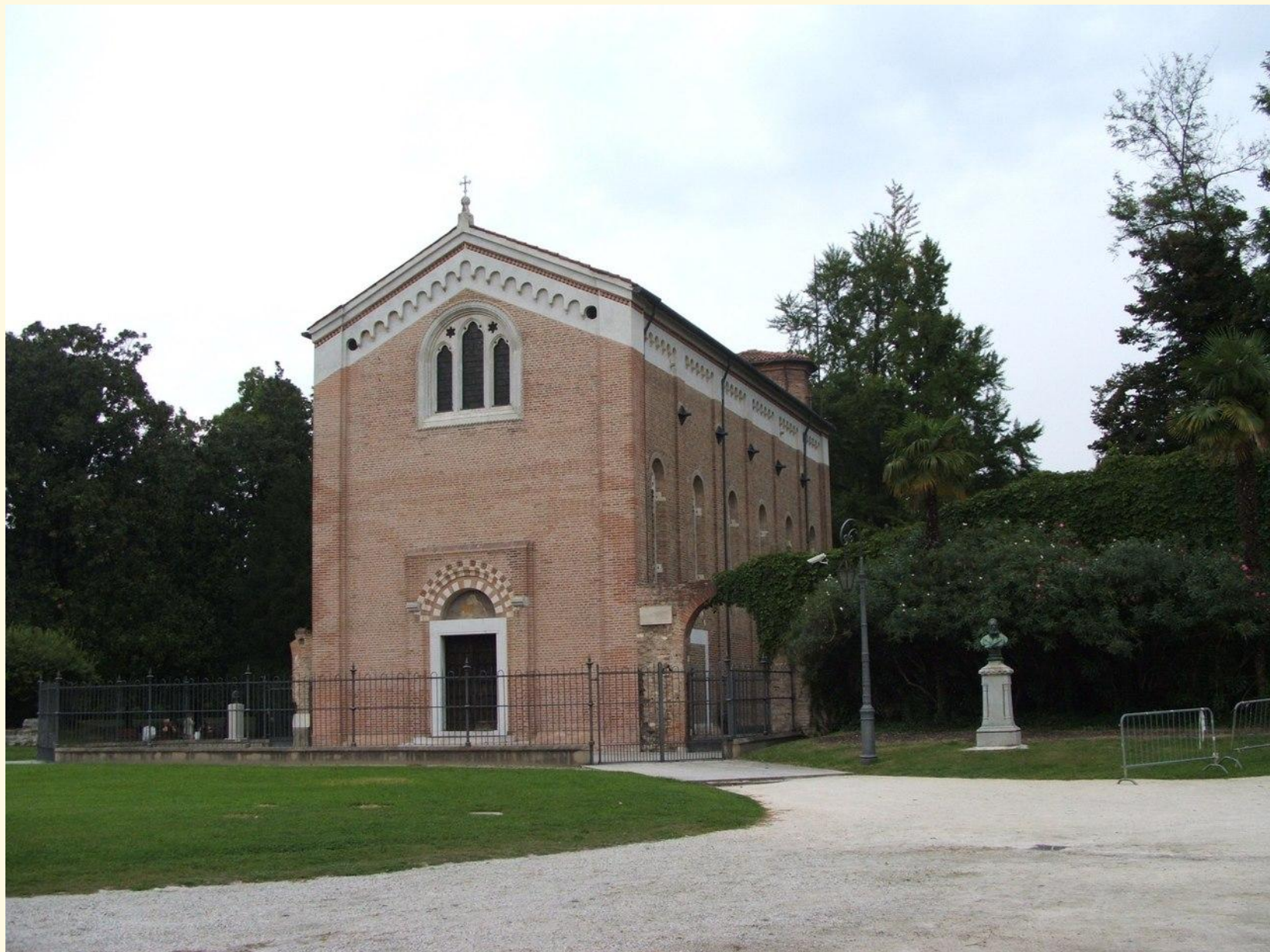
Капелла дель Арена (Скровеньи) в г. Падуя