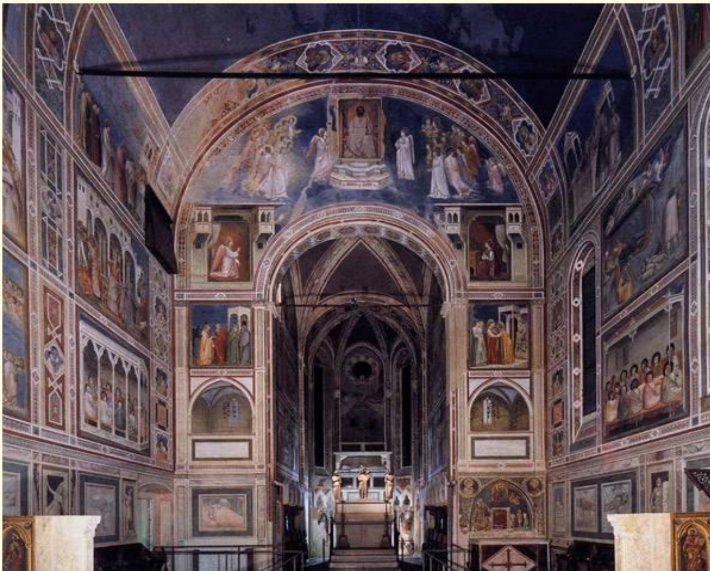
Капелла дель Арена. Вид напротив входа в часовню.