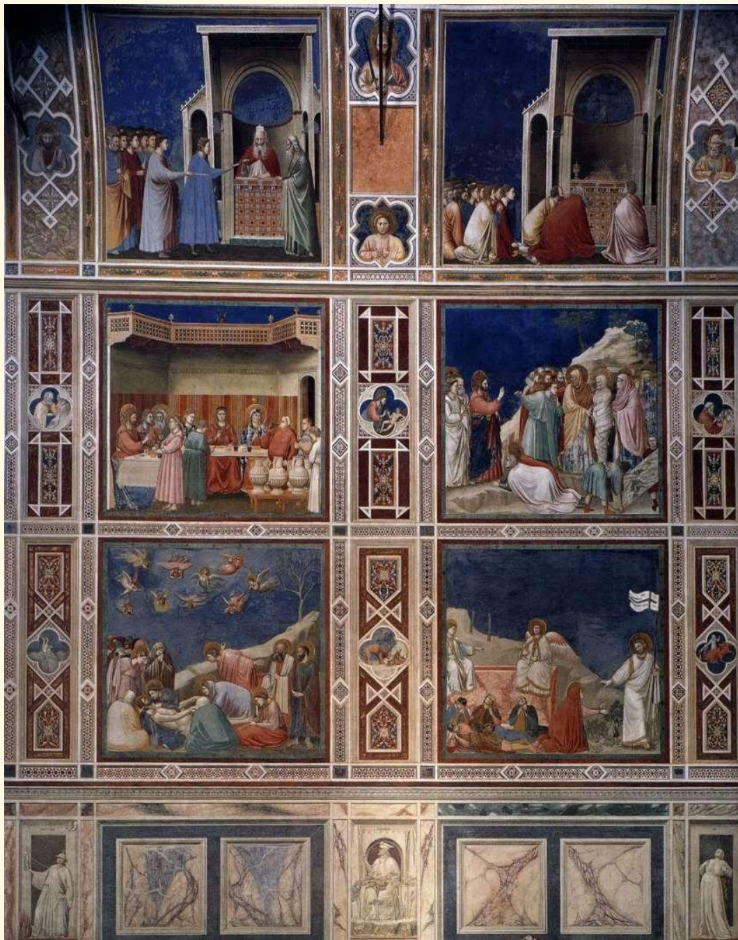
Фрагмент фресок в капелле дель Арена в Падуе