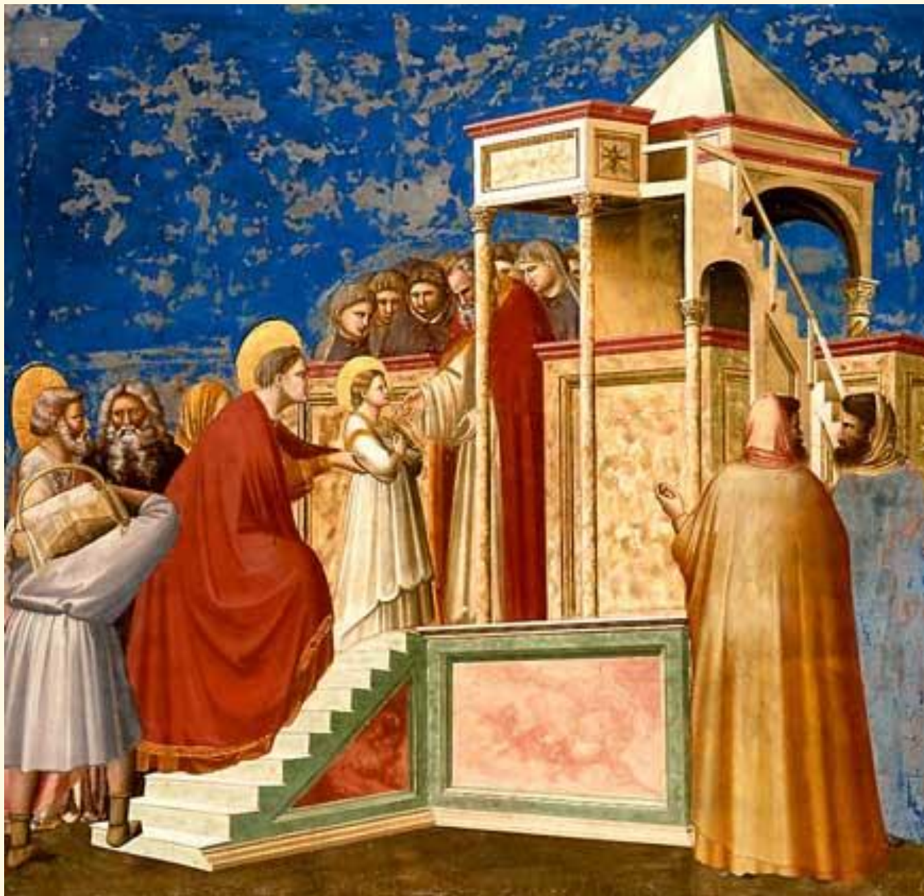
Введение Богородицы во храм.