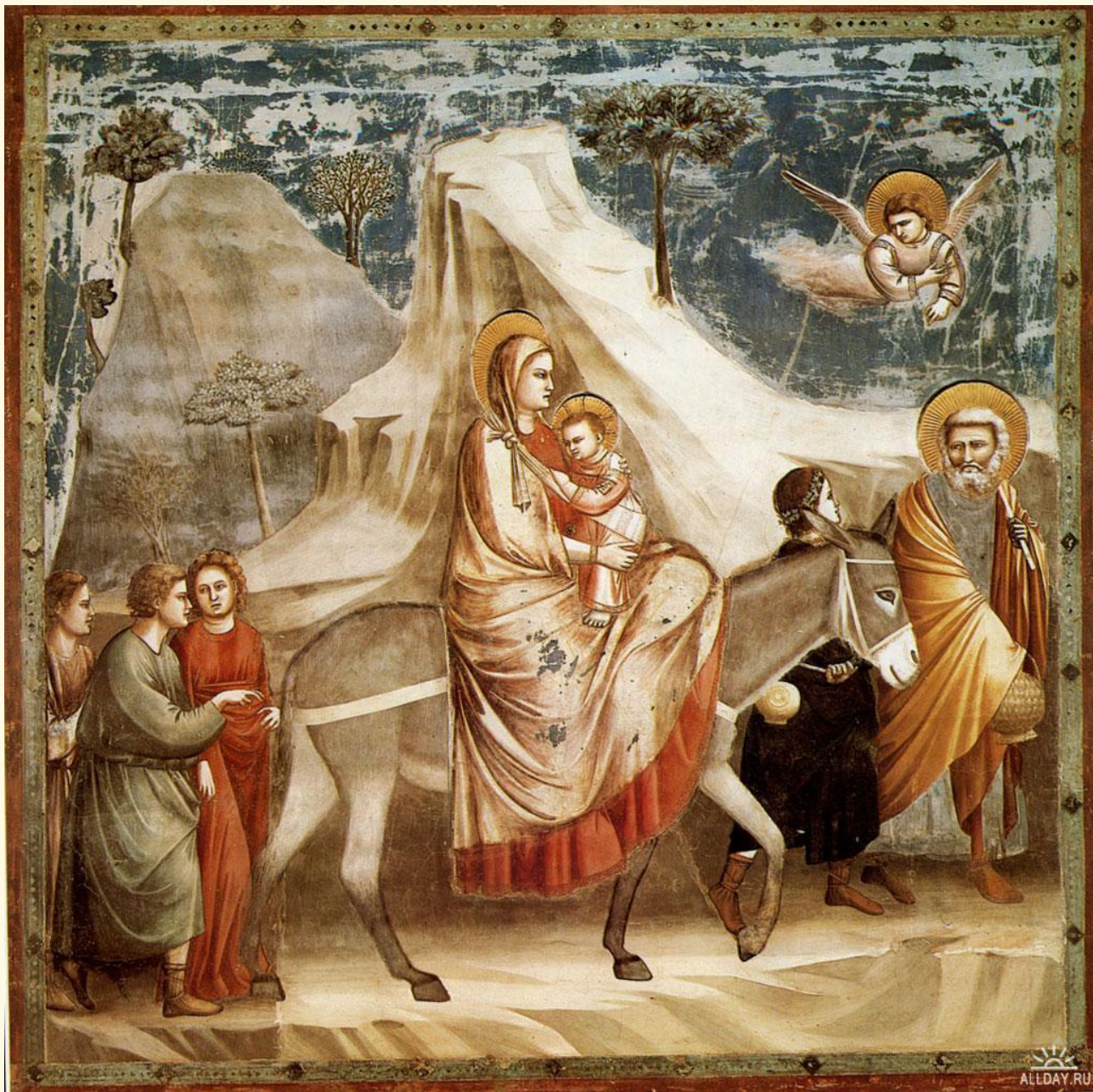
Бегство в Египет