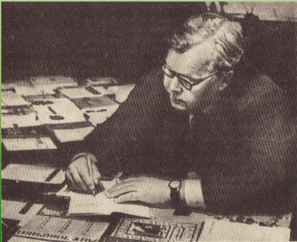
А. Т. Твардовский за редакторским столом. Москва, 1962 г.

В последние годы жизни Твардовский работал главным редактором журнала «Новый мир».