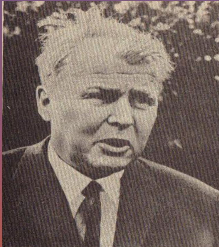
А. Т. Твардовский в Красной Пахре. 60-е годы.

Твардовский умер в 1971 году . «Он был нашей поэтической совестью», - написал поэт Кайсын Кулиев