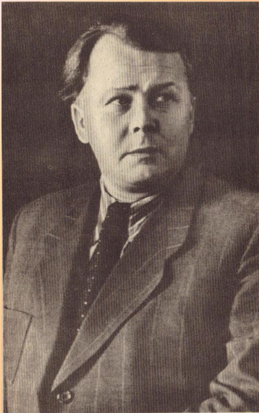
АЛЕКСАНДР ТРИФОНОВИЧ ТВАРДОВСКИЙ 1910-1971