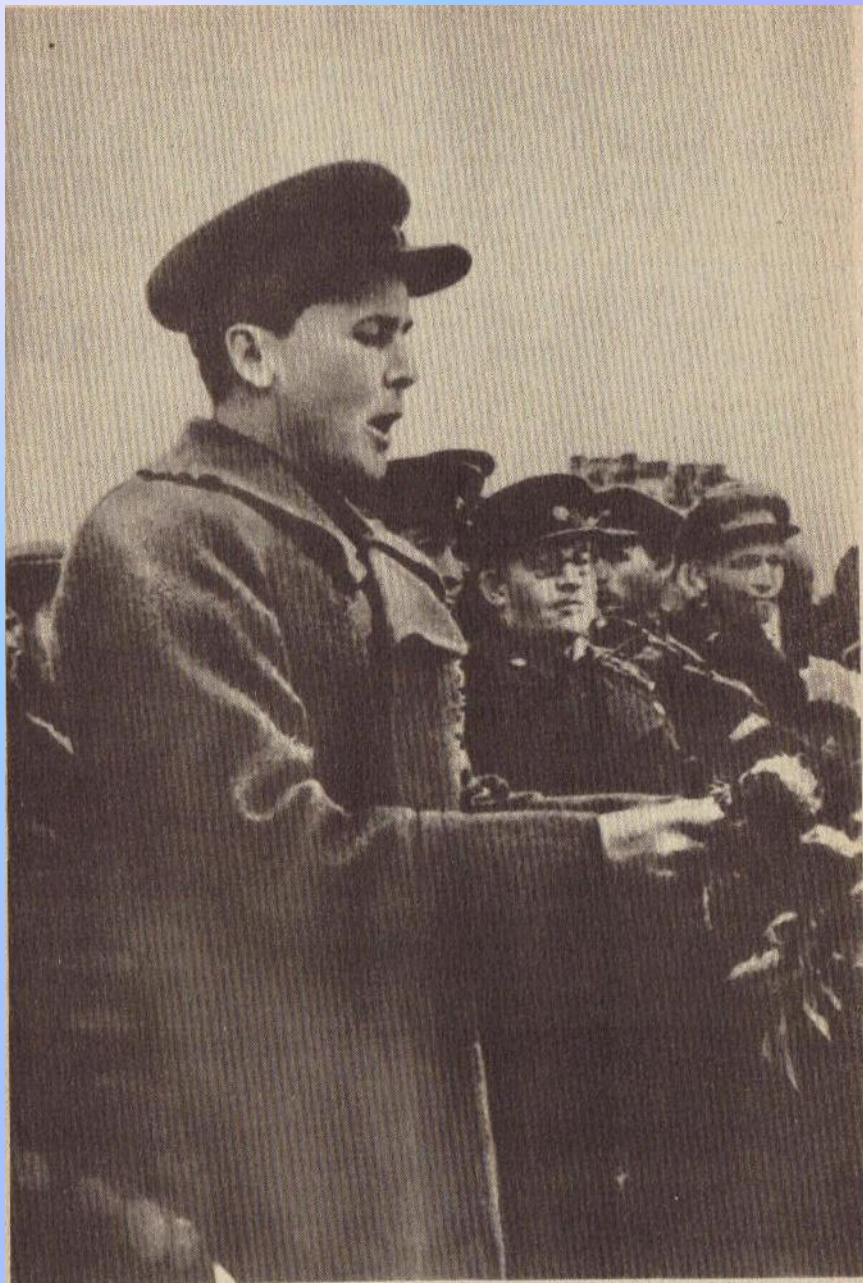
А. Т. Твардовский на митинге, посвященном освобождению Смоленска. Октябрь, 1943 г.

Самая знаменитая поэма о войне «Василий Тёркин» печаталась в фронтовых газетах.