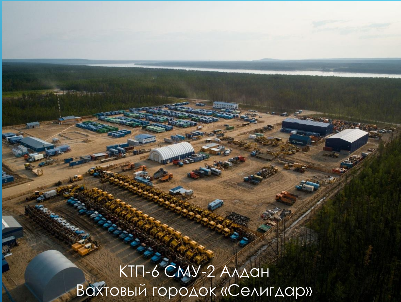
КТР-6 СМУ-2 Алдан Вахтовый городок «Селигдар»