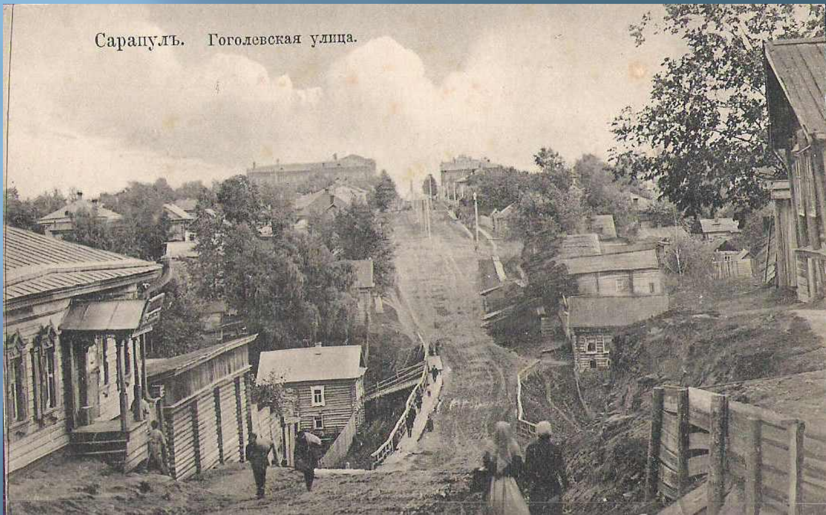
Сарапуль. Гоголевская улица.