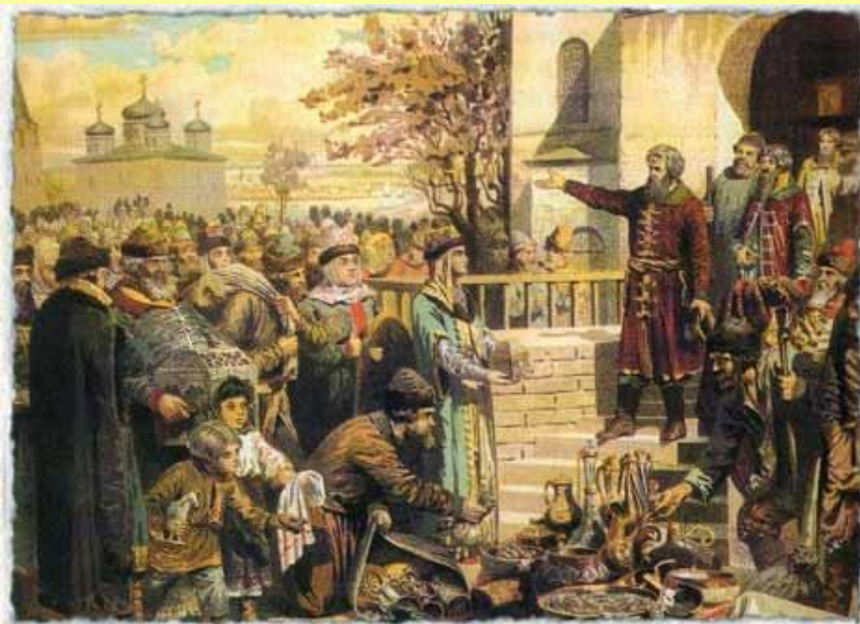
Нижегородцы откликаются на призыв Минина собрать средства для ополчения. Картина А.Д.Кившенко, XIX в.

Военный предводитель – князь Д.М. Пожарский.