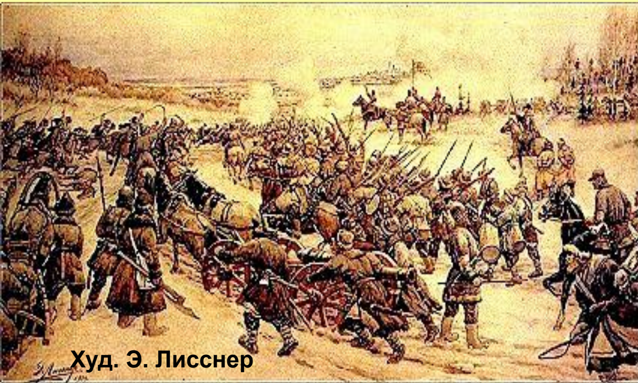
Худ. Э. Лисснер

Совместно с дворянскими отрядами И. Пашкова, П. Ляпунова и Г. Сумбулова Болотников осадил Москву, встав лагерем близ села Коломенского.