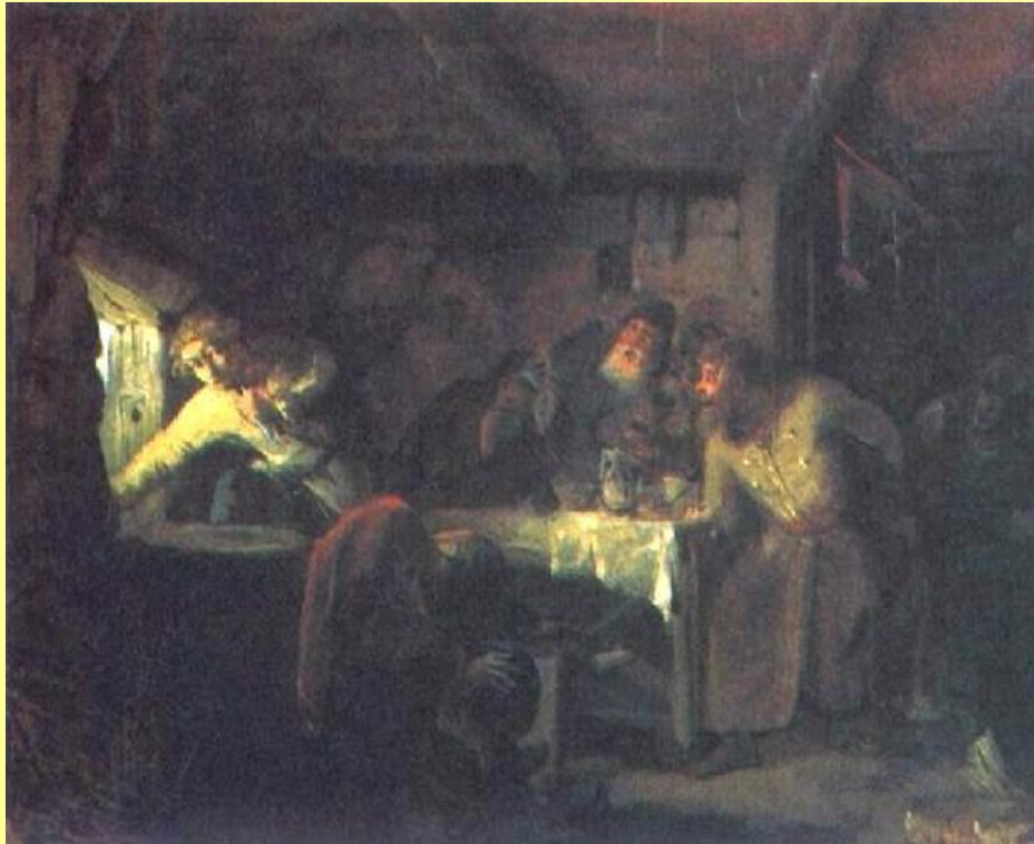
Бегство Гришки Отрепьева из корчмы на литовской границе. Худ. Г. Мясоедов

В 1604 г. в Литве объявился самозванец, называвший себя Дмитрием – беглый монах Чудова монастыря Григорий Отрепьев.