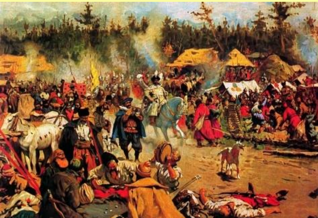
Смутное время. Худ. С. Иванов

Бесчинства и грабежи тушинцев оттолкнули от них поддерживавшее их поначалу население