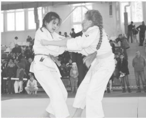
Дзюдо набирает популярность у спортсменов, любящих спорт.