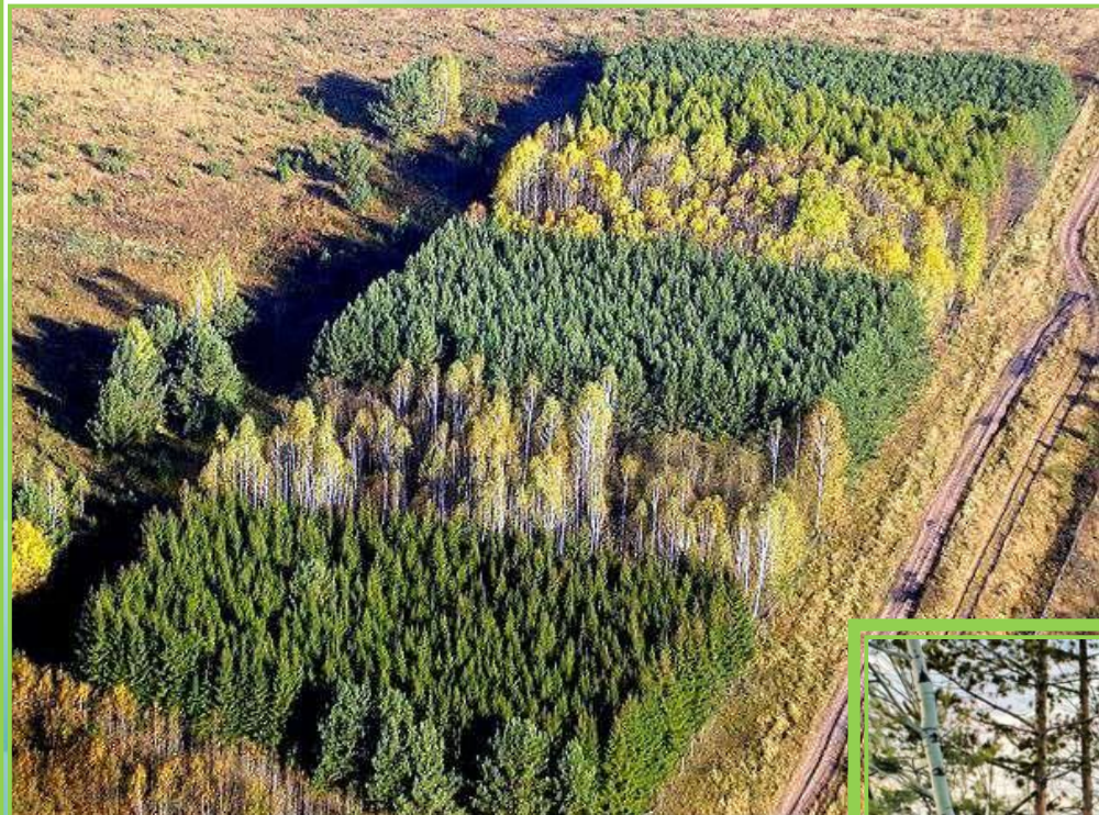
ДЕЛЯНКА (место под вырубку)