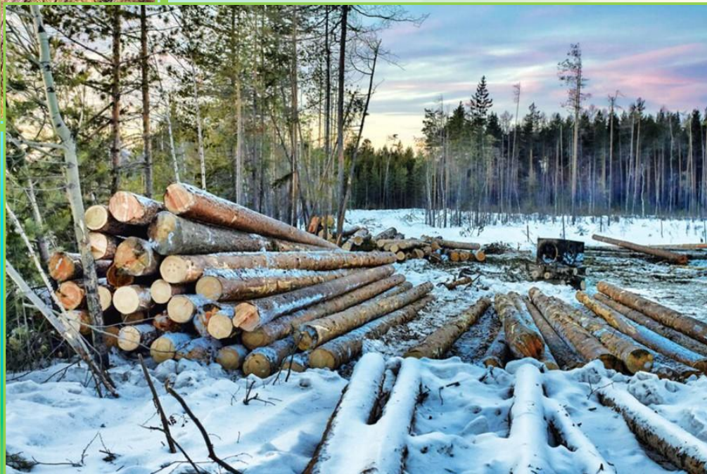
ЛЕСИ́НА (часть ствола от корня до кроны, идущая в строевой лес)