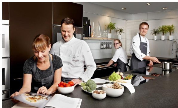
Обучение на курсах