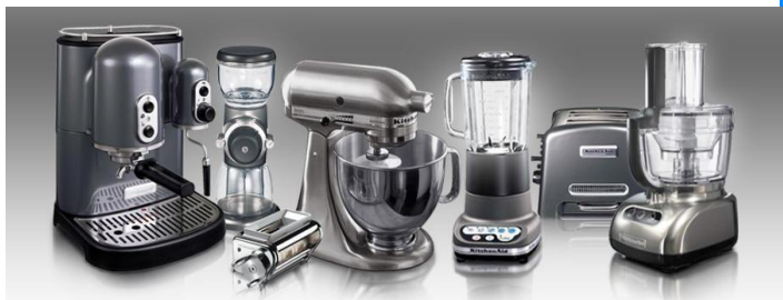
Набор техники для БОНУС