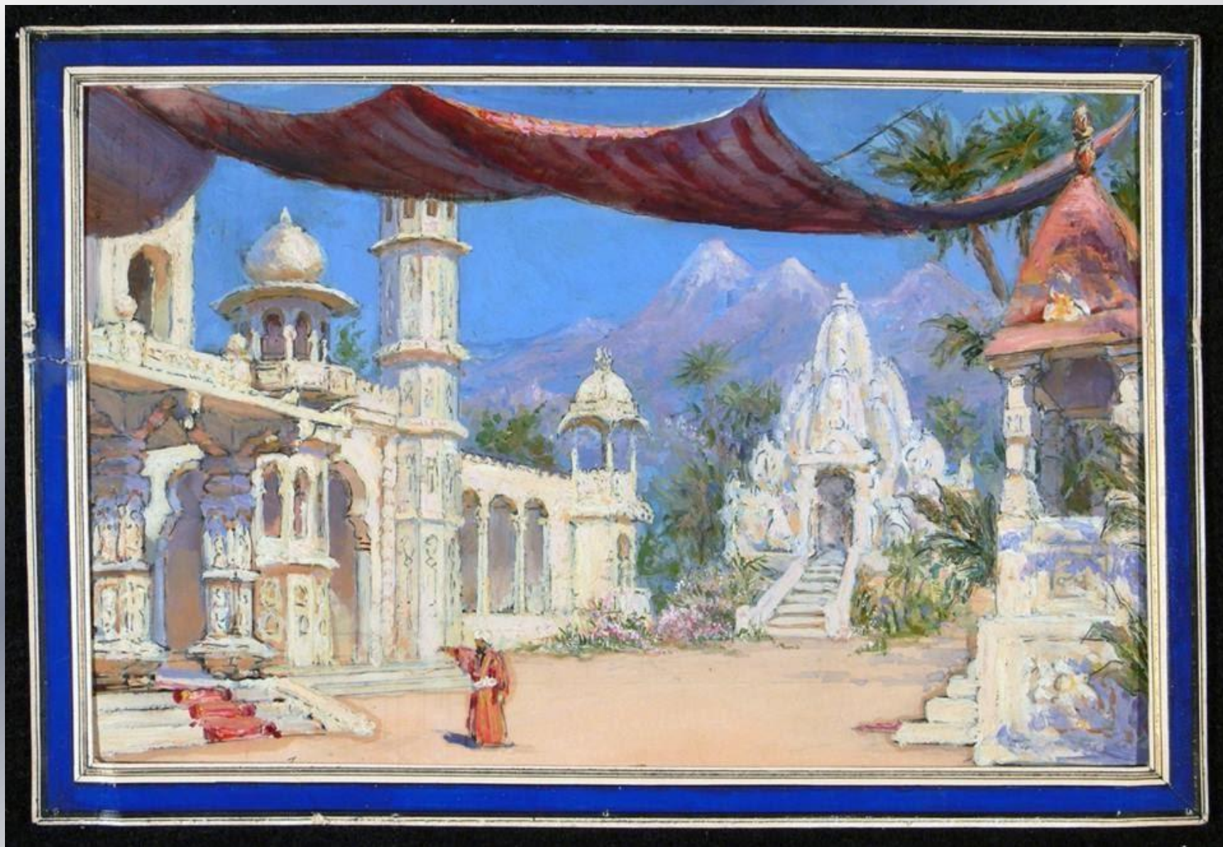
Карл Вальц. Эскиз декорации «Восточный дворец в саду» к фантастической сказке «Разрыв-трава» (Москва, Новый театр, 1901 г.).