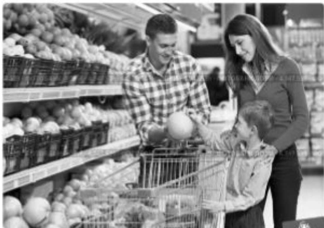
Семья выбирает продукты в супермаркете