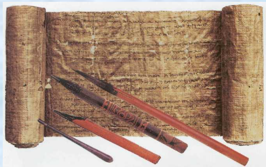
Папирусный свиток и специальные перья для письма.