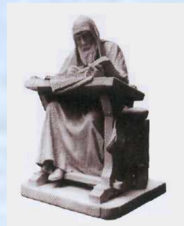
Памятник Нестору: монаху-летописцу

- в ту пору книга ценилась больше не за украшения, а за содержание: