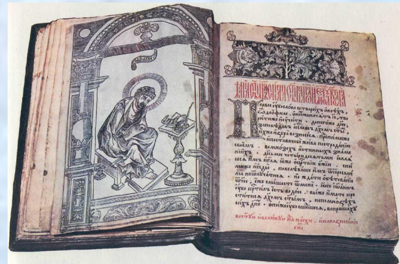
«Апостол» Ивана Федорова