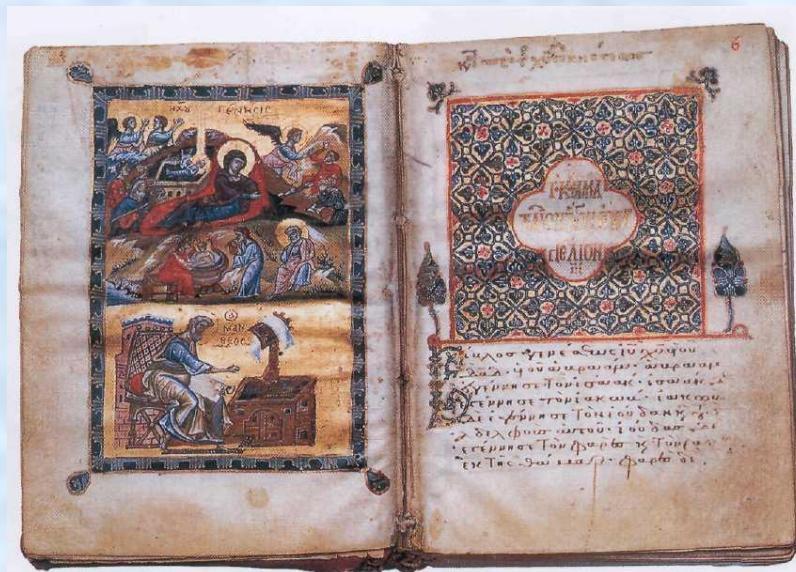
Рукописная книга на пергаменте.