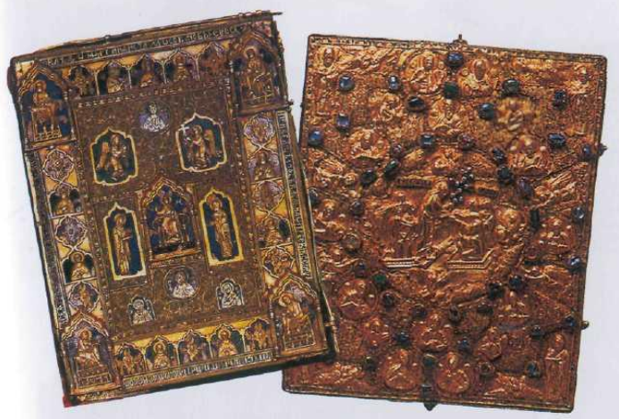
Древнерусские переплеты, украшенные драгоценностями.

«Ибо ум без книг, как птица без пера. Также как она взлететь не может, также и ум не