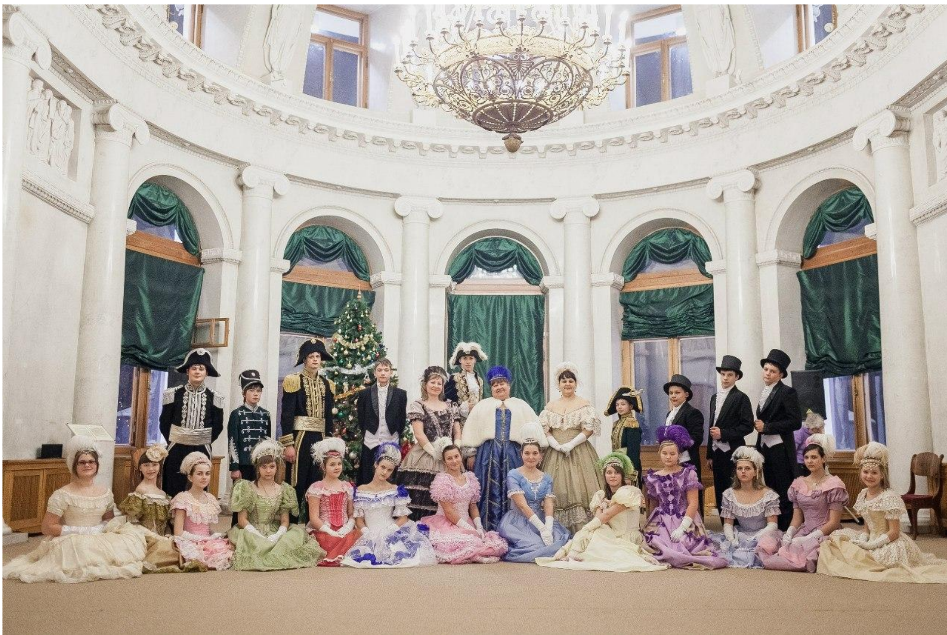
Костюмированный бал. Март 2015 г.