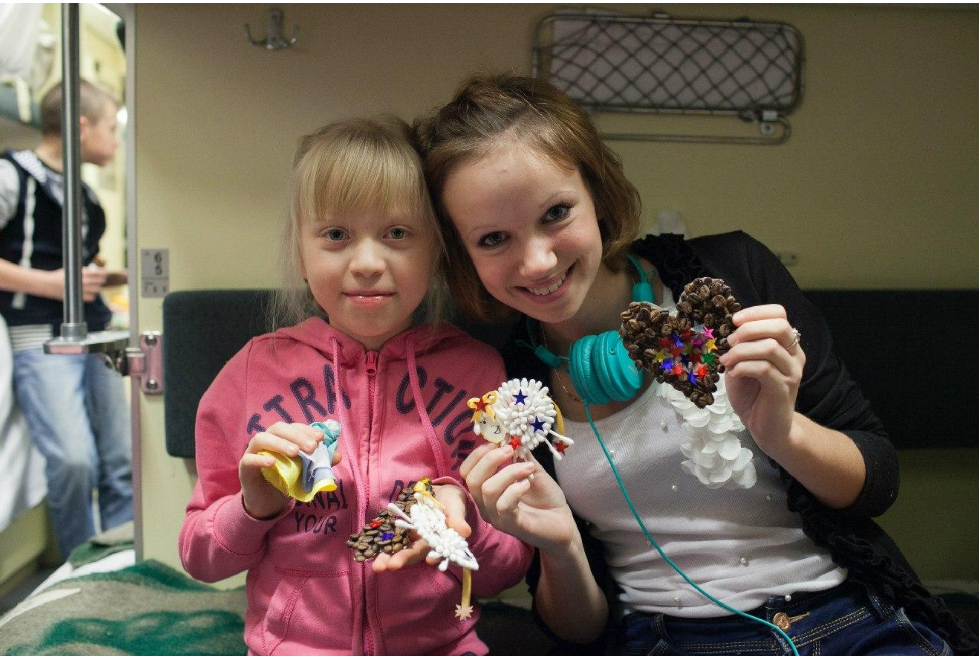
В поезде проходят мастер-классы. Ребята изготавливают сувениры.