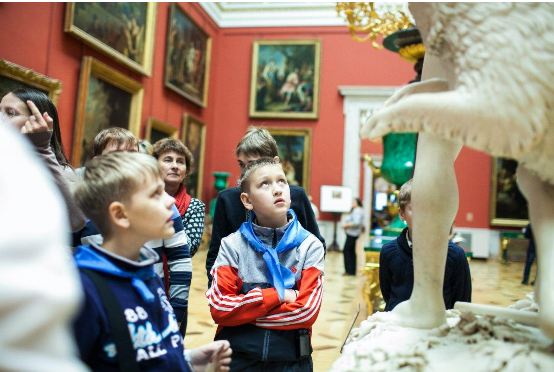
В Эрмитаже. Ноябрь 2014 г.