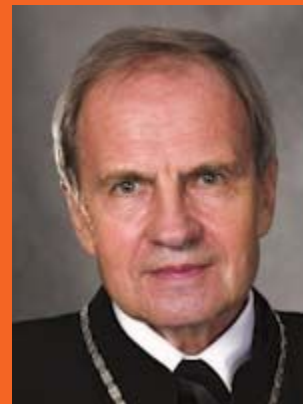
ЗОРЬКИН Валерий Дмитриевич