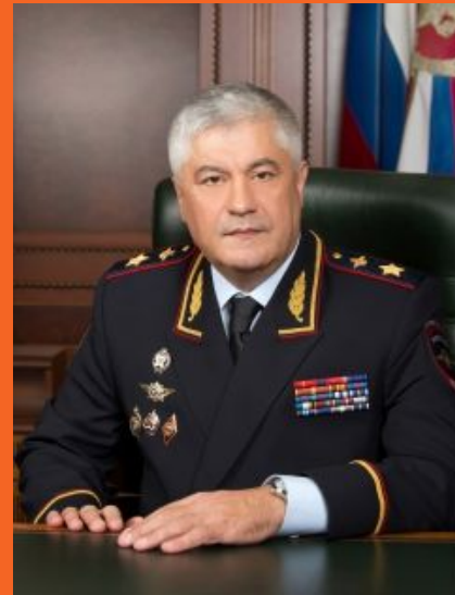
Владимир Александрович Колокольцев

Министр внутренних дел РФ, генерал полиции РФ