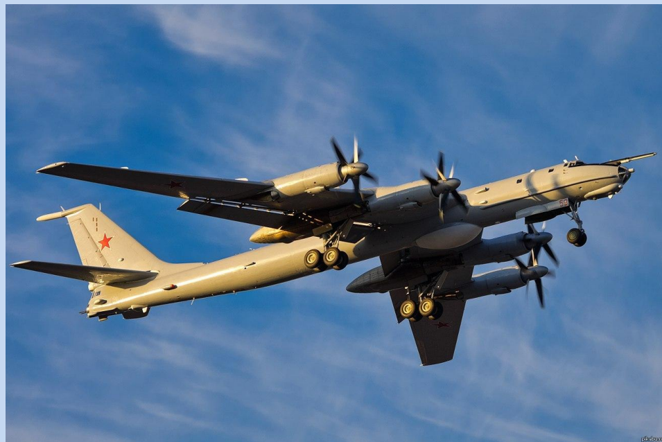
Противолодочный самолет Ту-142