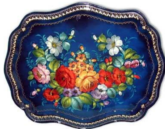
букет в раскидку