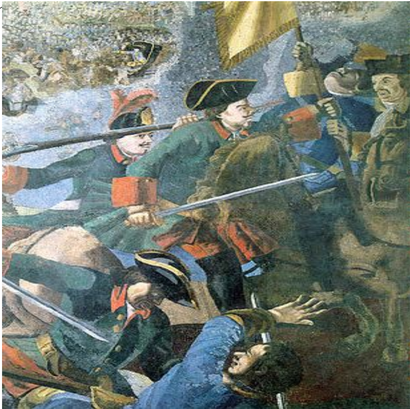
«Полтавская баталия». Фрагмент мозаики М. В. Ломоносова