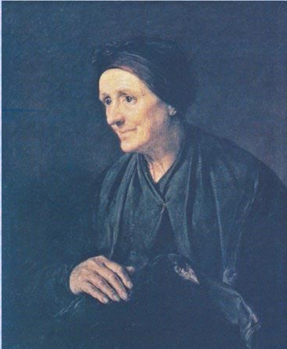
«Старуха с курицей»