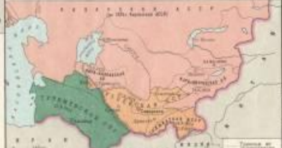
2. ФЕДЕРАТИВНО-ГОСУДАРСТВЕННЫЕ РЕСПУБЛИКИ РЕСЕРВНЫЕ СЛУЖБЫ АРМИИ (1921 - 1922 г.)