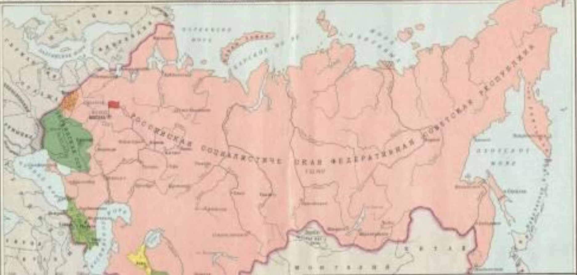
1. СОВЕТСКИЙ БАНК И ЗАКАВКАЗСКАЯ СОЦИАЛИСТИЧЕСКАЯ ФЕДЕРАТИВНАЯ СОВЕТСКАЯ РЕСПУБЛИКА