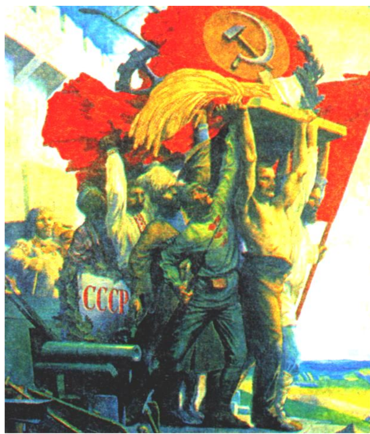
С.Карпов. Дружба народов.

Представители коренных народов привлекались к управлению государством, для них создавались льготы при приеме в ВУЗы. Но «коренизация» имела и отрицательные моменты. В Киргизии началось насильственное переселение русских с их земель. На Украине украинский язык стал государственным и без его знания нельзя было занимать никакие должности.