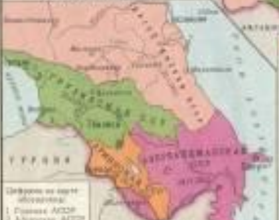
Цвета по карте 1. Советский АСФР 2. Азербайджан АСФР