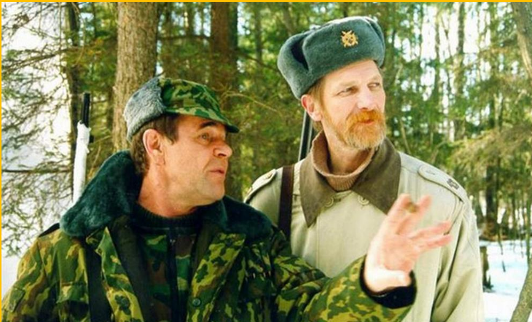
Особенности национальной охоты, Александр Рогожкин, 1995