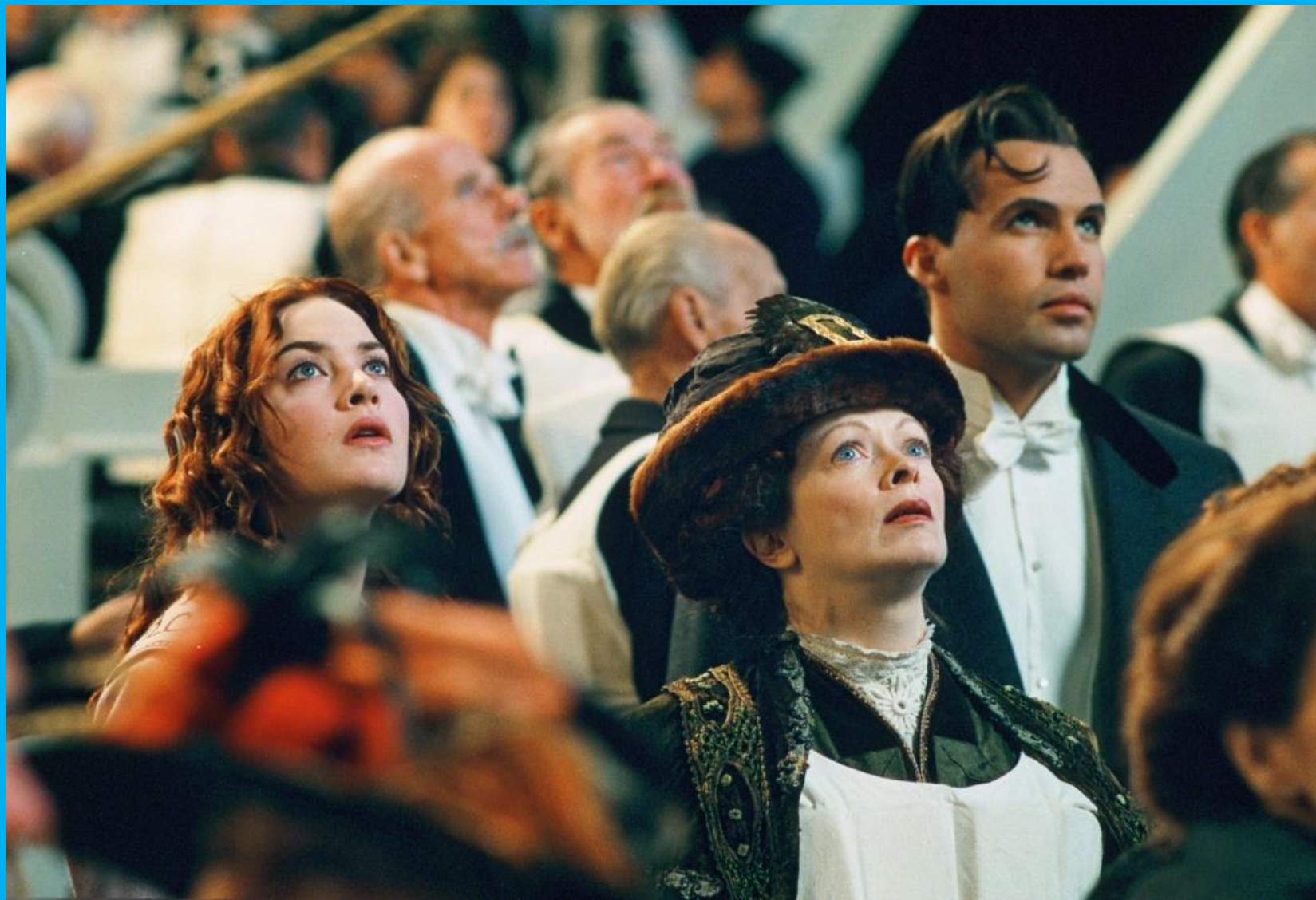
Титаник, Дж. Кэмерон, 1997