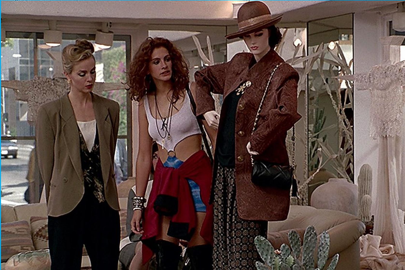
Красотка, Гэрри Маршалл, 1990