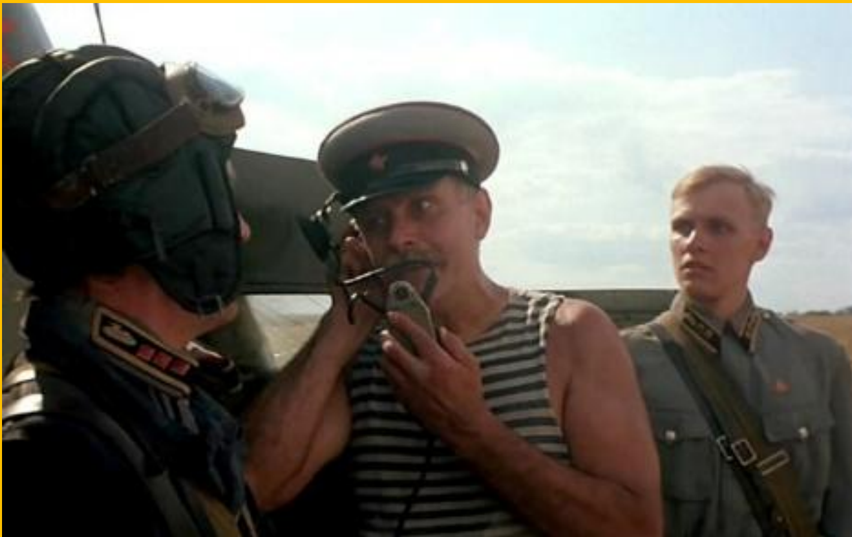
Утомлённые солнцем, Никита Михалков, 1994