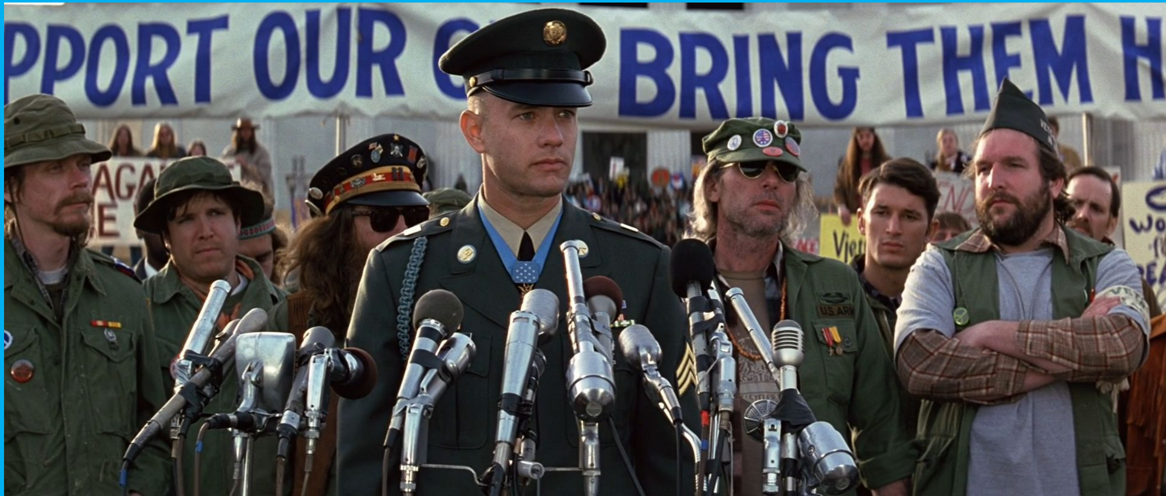
Форрест Гамп, Роберт Земекис, 1994