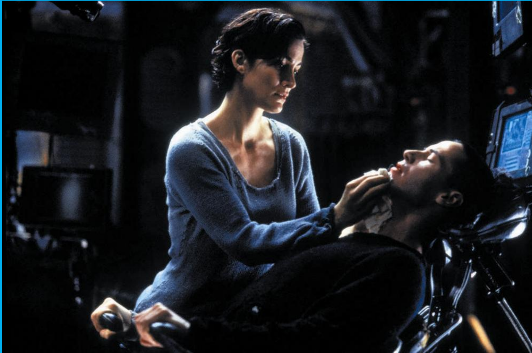
Матрица, Эндрю и Лоуренс Вачовски, 1999