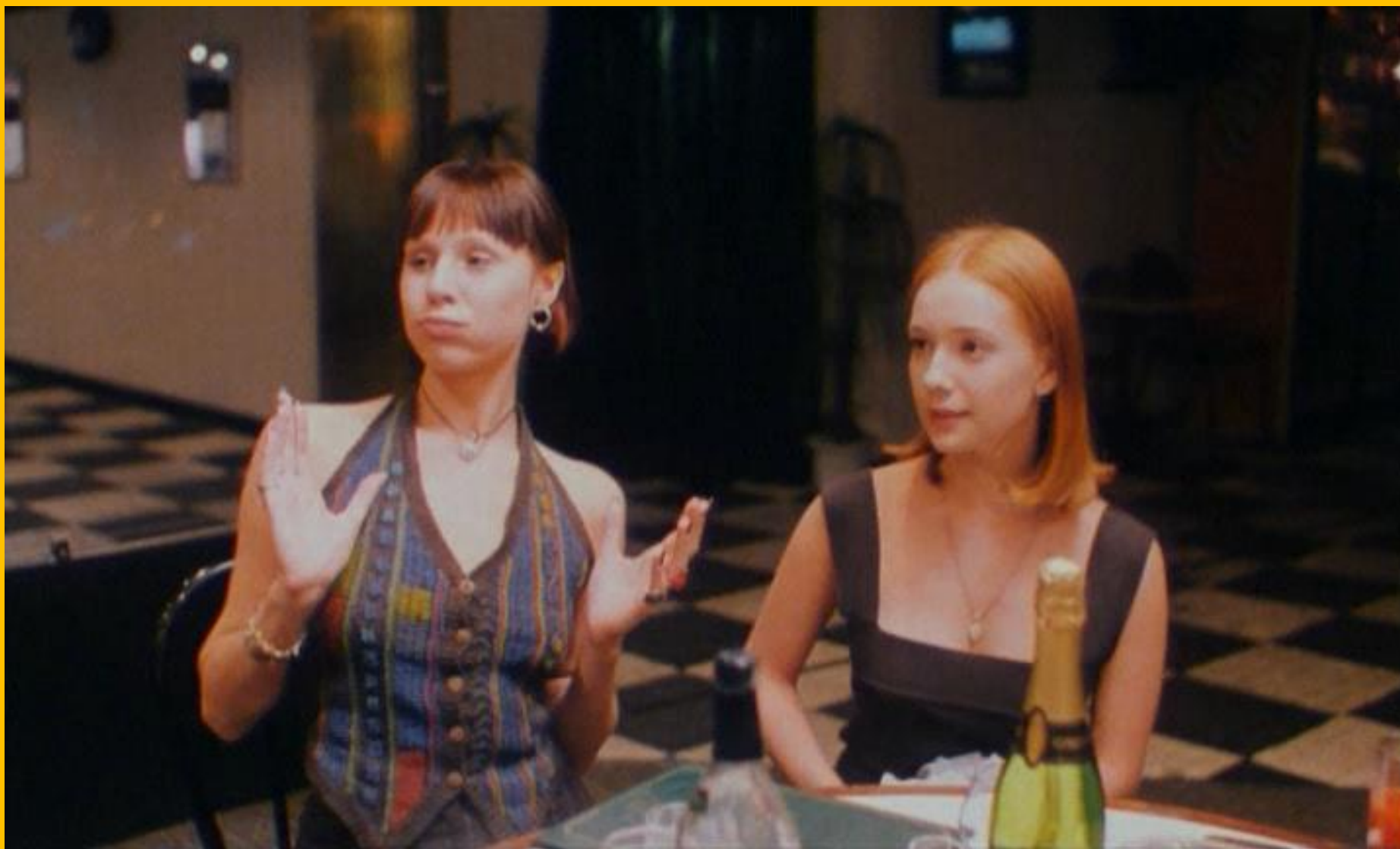
Страна глухих, Валерий Тодоровский, 1998