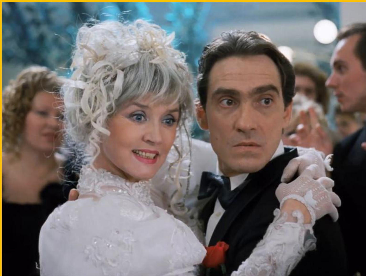
Ширли-мырли, Владимир Меньшов, 1995