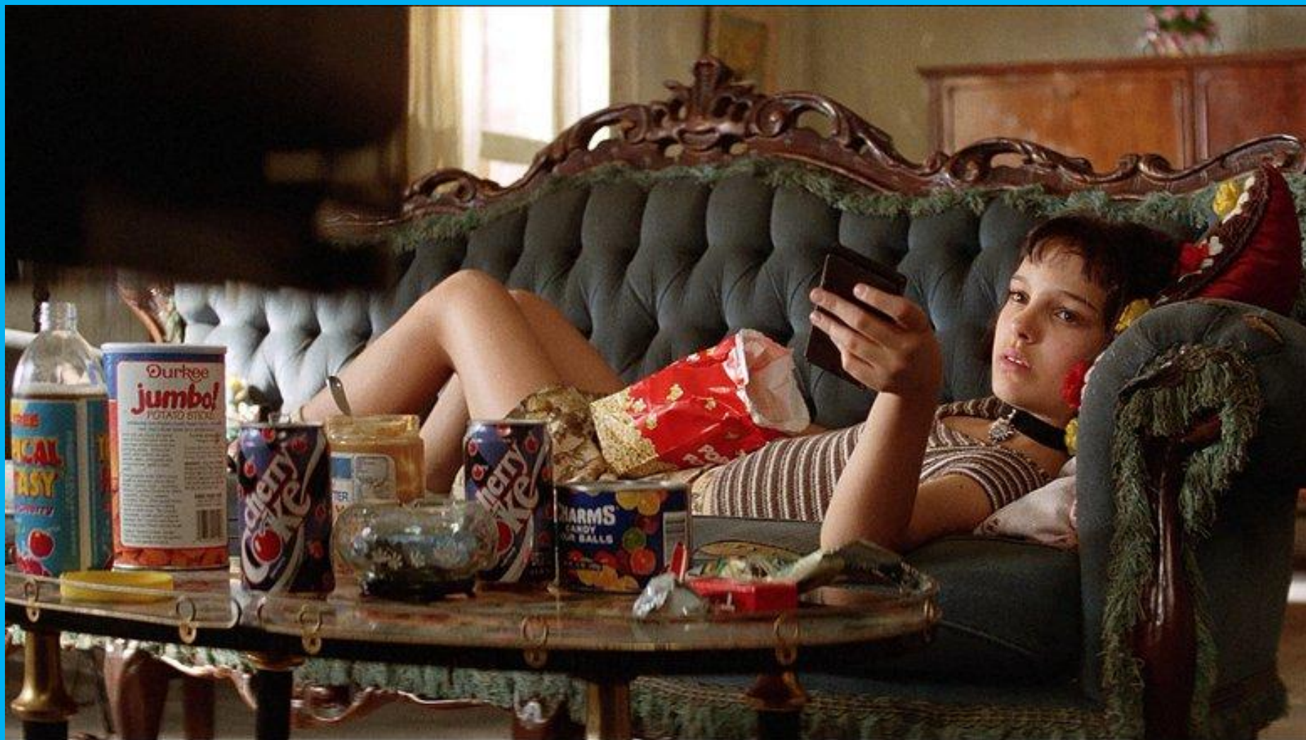
Леон, Люк Бессон, 1994