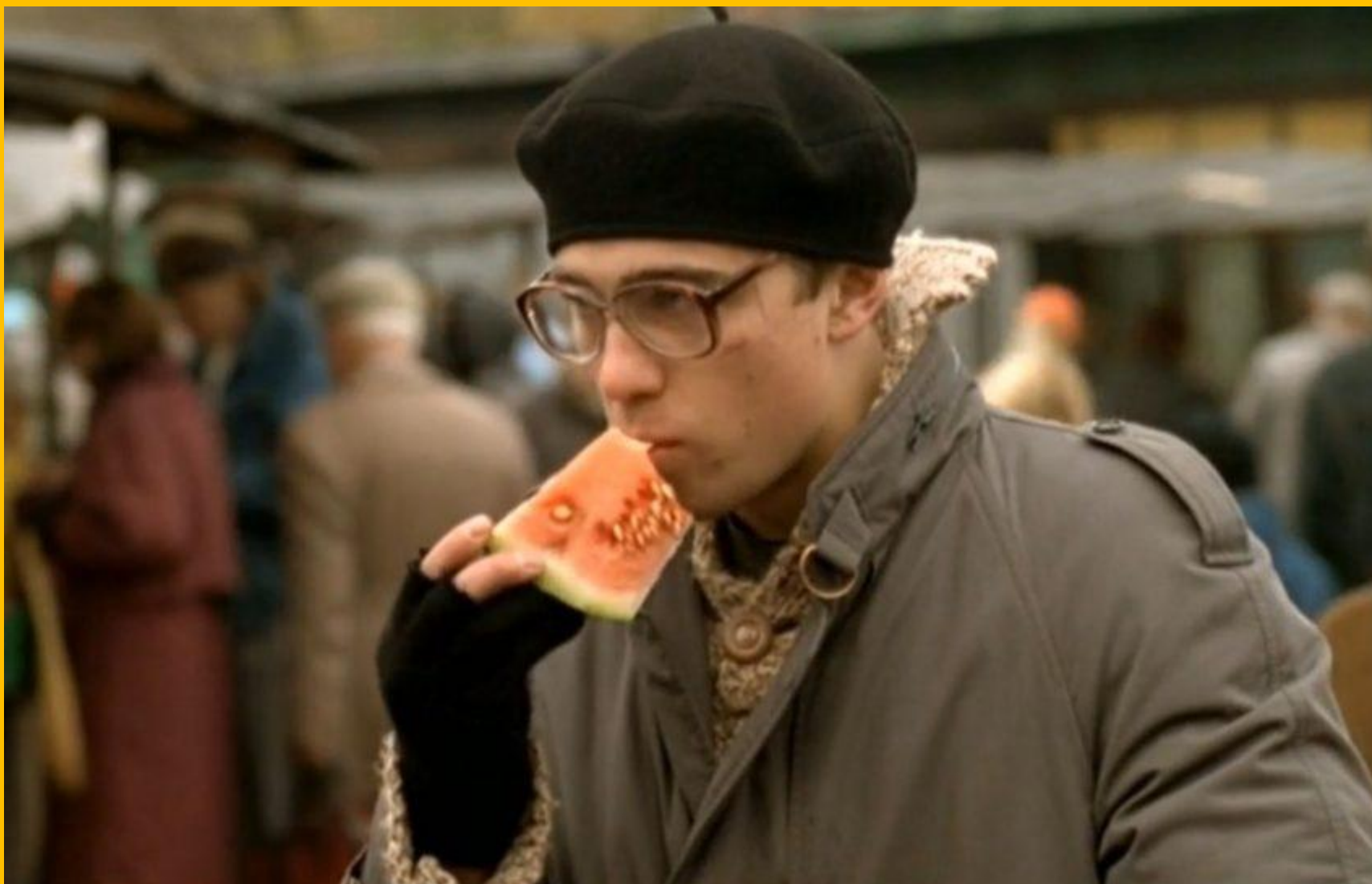
Брат, Алексей Балабанов, 1997