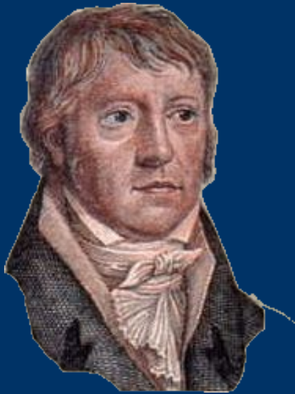
Гегель. «Феноменологія духа».

Істинне це ціле. Але ціле є тільки сутність , яка завершується через свій розвиток. Про абсолютне необхідно сказати, що воно по суті є результатом , що воно лише на прикінці є тим, що воно є насправді; і в тому-то й полягає його природа, що воно є дійсне, суб'єкт або становлення самим собою для себе.