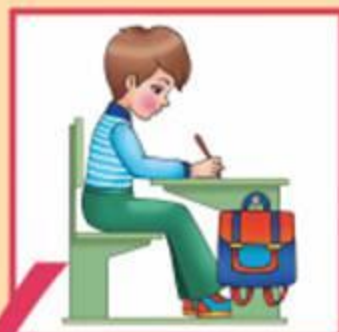
Посадка при письме