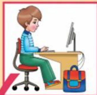
Посадка за компьютером