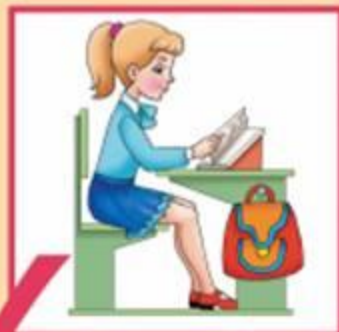
Посадка при чтении