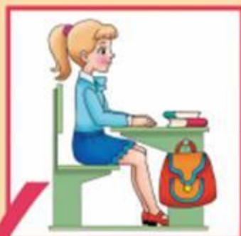
Посадка «готов к работе»