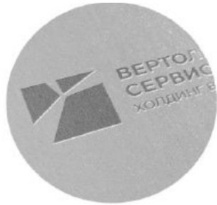
Логотип выполнен методом тиснения фольгой