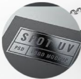
Так же отдельные детали для выразительности можно покрыть глянцевым лаком