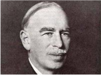
Дж.М. Кейнс 1883-1946