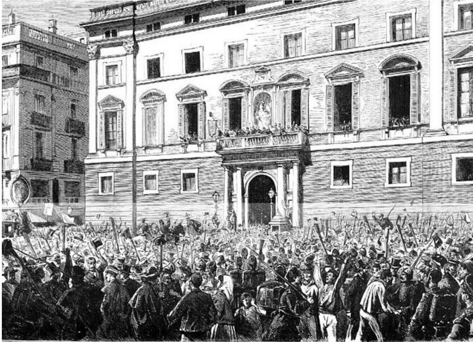
Proclamación de la República en Barcelona (Plaza de Santiago)