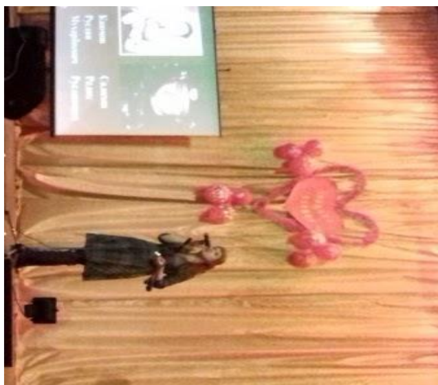
Концерт «Горячее сердце»