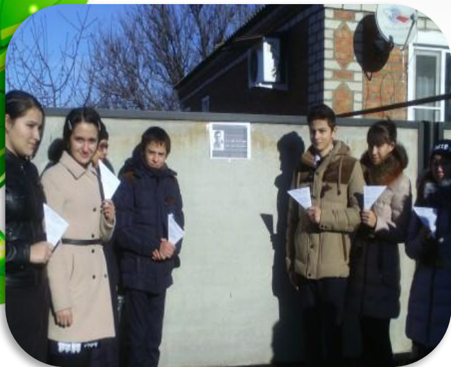
Акция «Письмо ветерану»