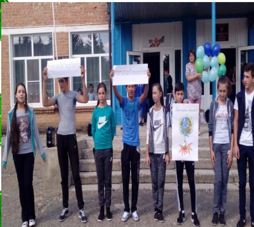
Флешмоб «Зеленая Россия»