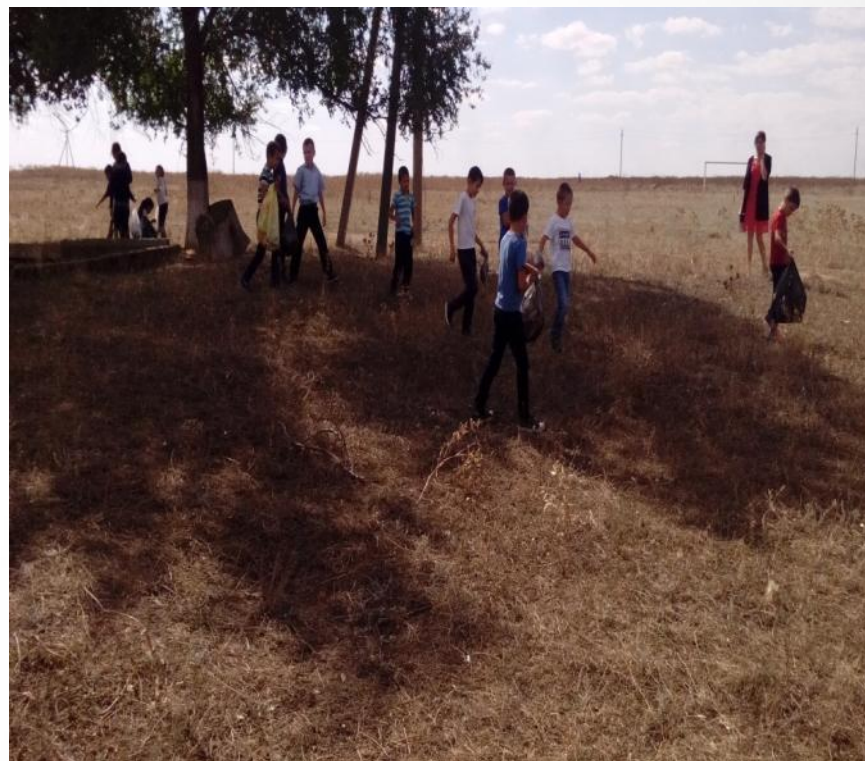
Акция «Чистая лесополоса»