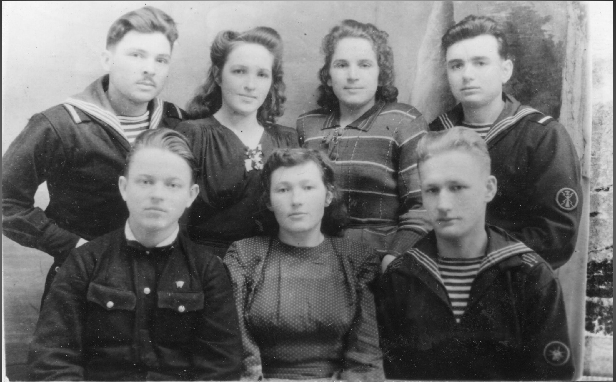
Делегация ярославского комсомола с членами экипажа. 1947