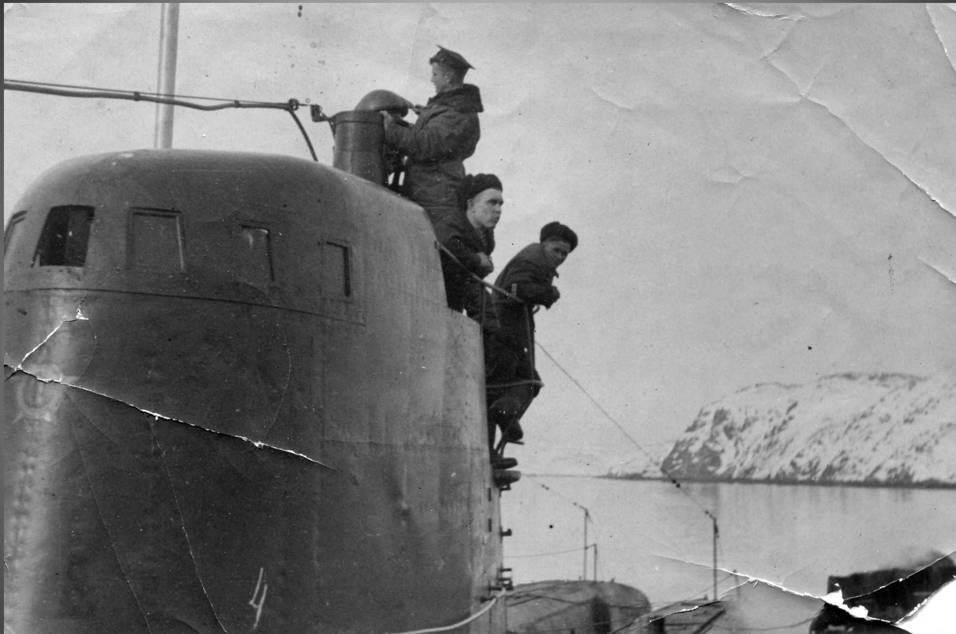
Подводная лодка М-104 «Ярославский комсомолец». 22.03.1944