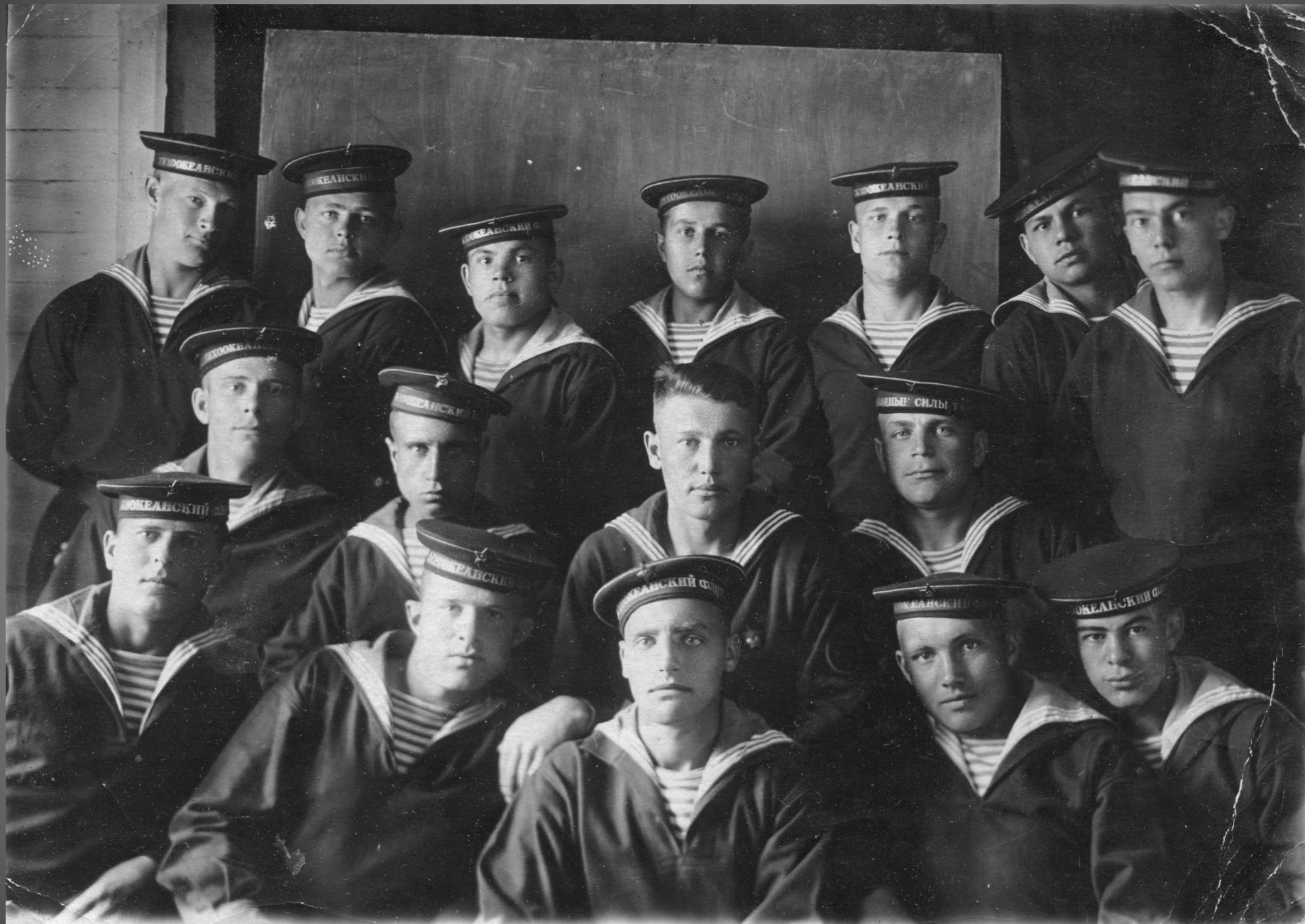
Личный состав подводной лодки М-104 в Сормово, Горький. 23.06.1942