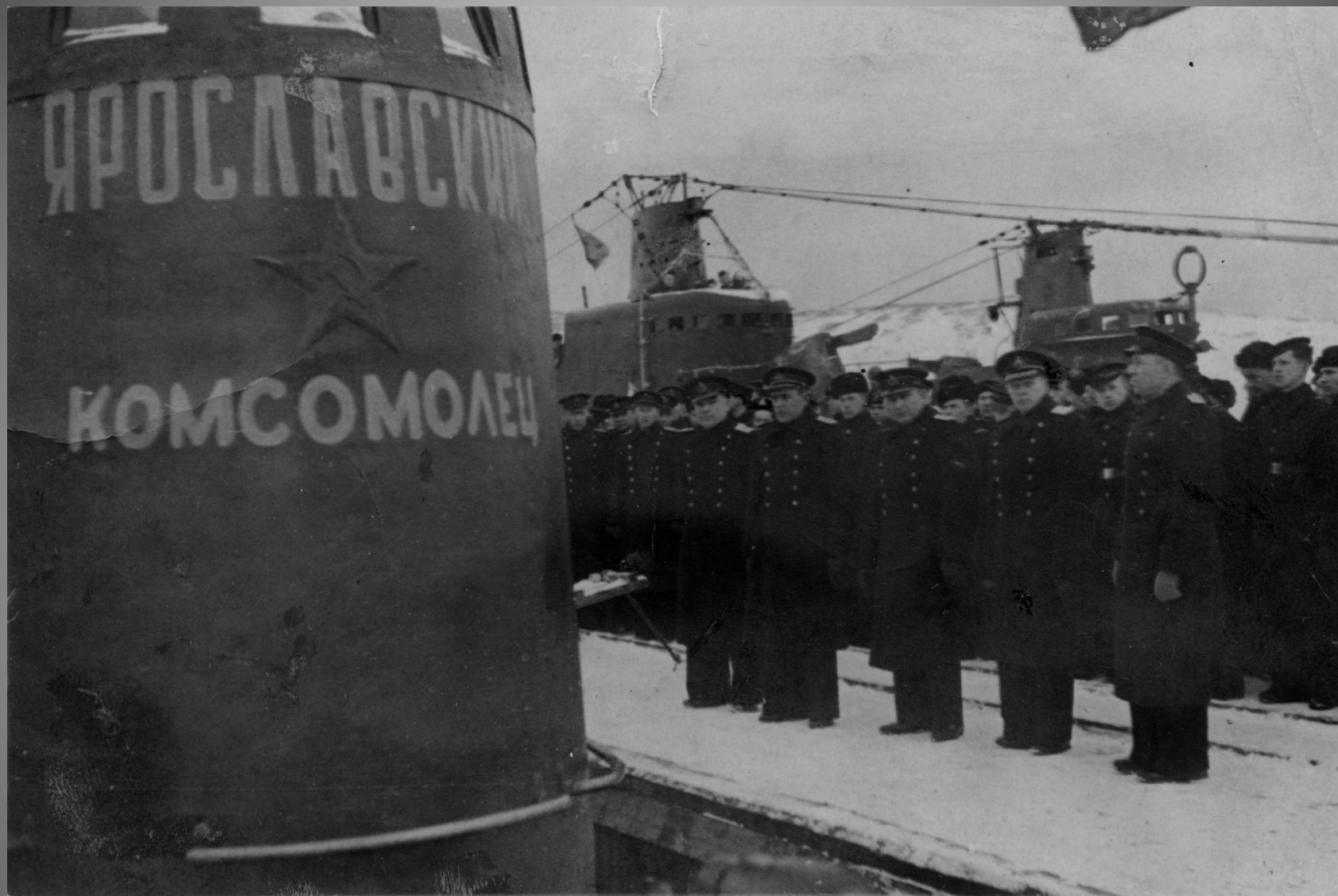
Церемония передачи подводной лодки ВМФ. 1943