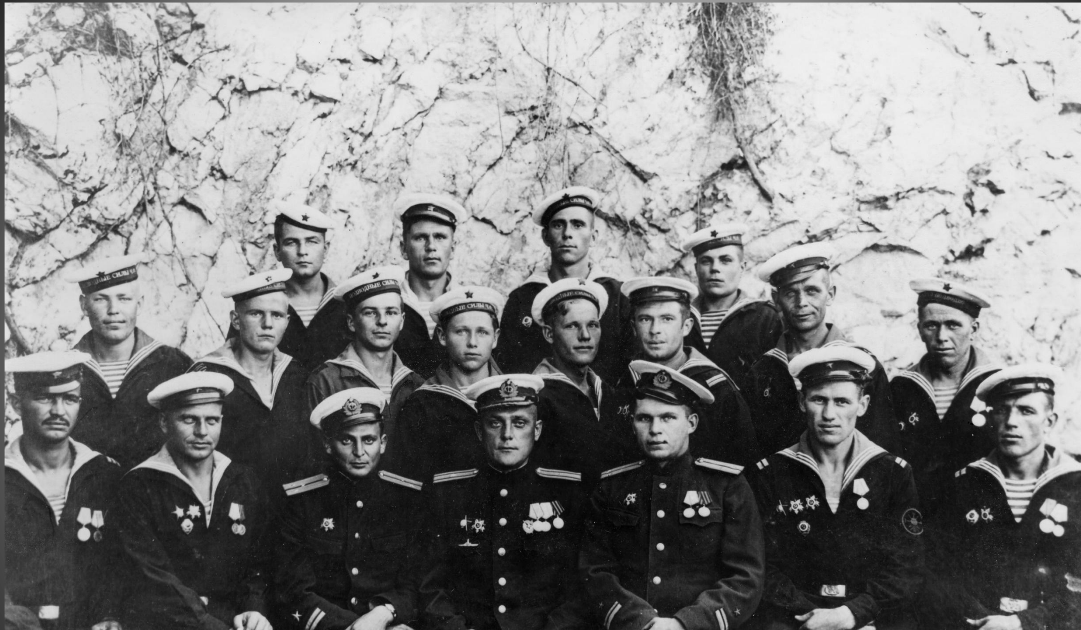
Экипаж подводной лодки М-104