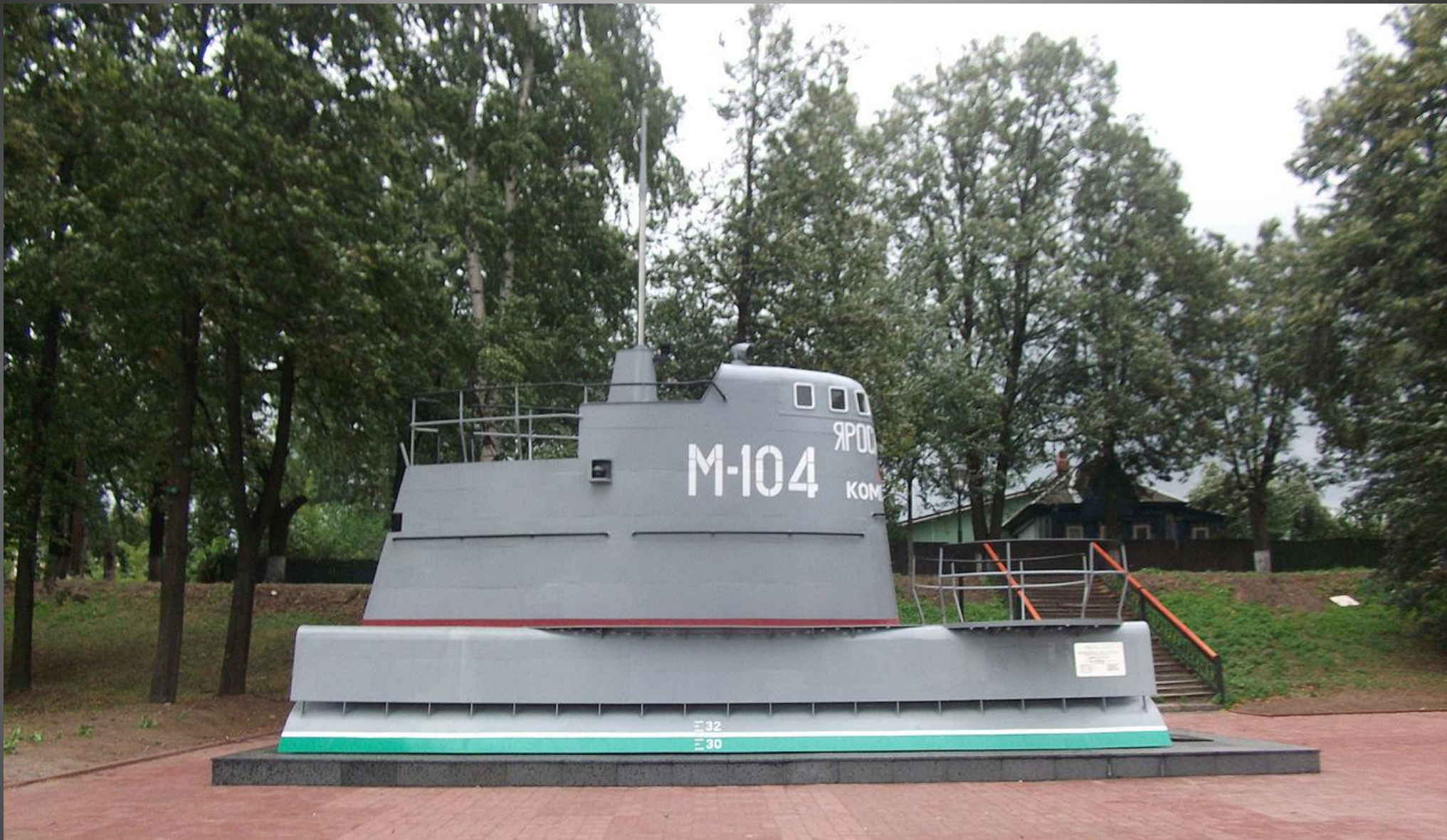
Памятник подводной лодке «Ярославский комсомолец» на Тверицкой набережной