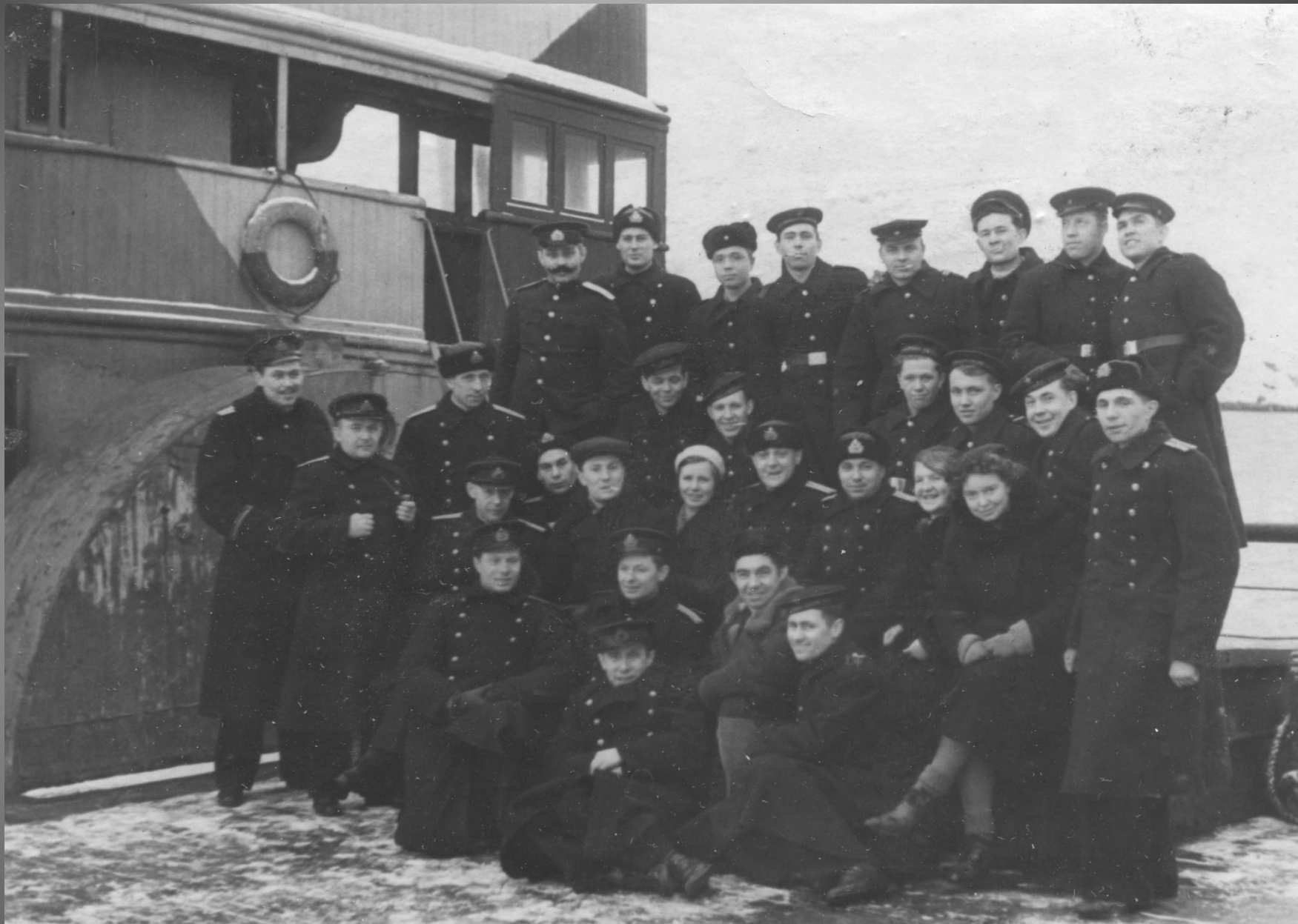
Делегация ярославского комсомола с личным составом лодки. 1943