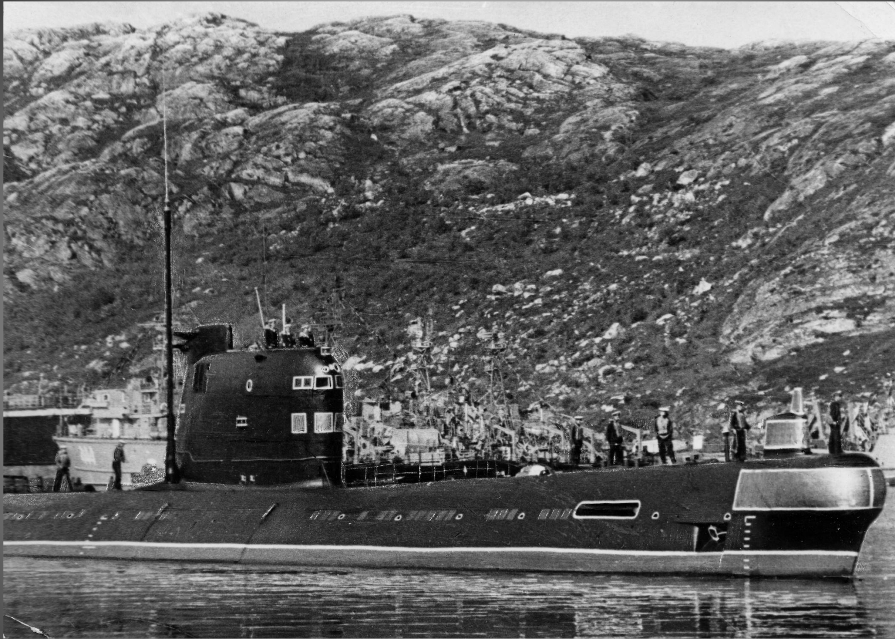
Подводная лодка Б-26 «Ярославский комсомолец»