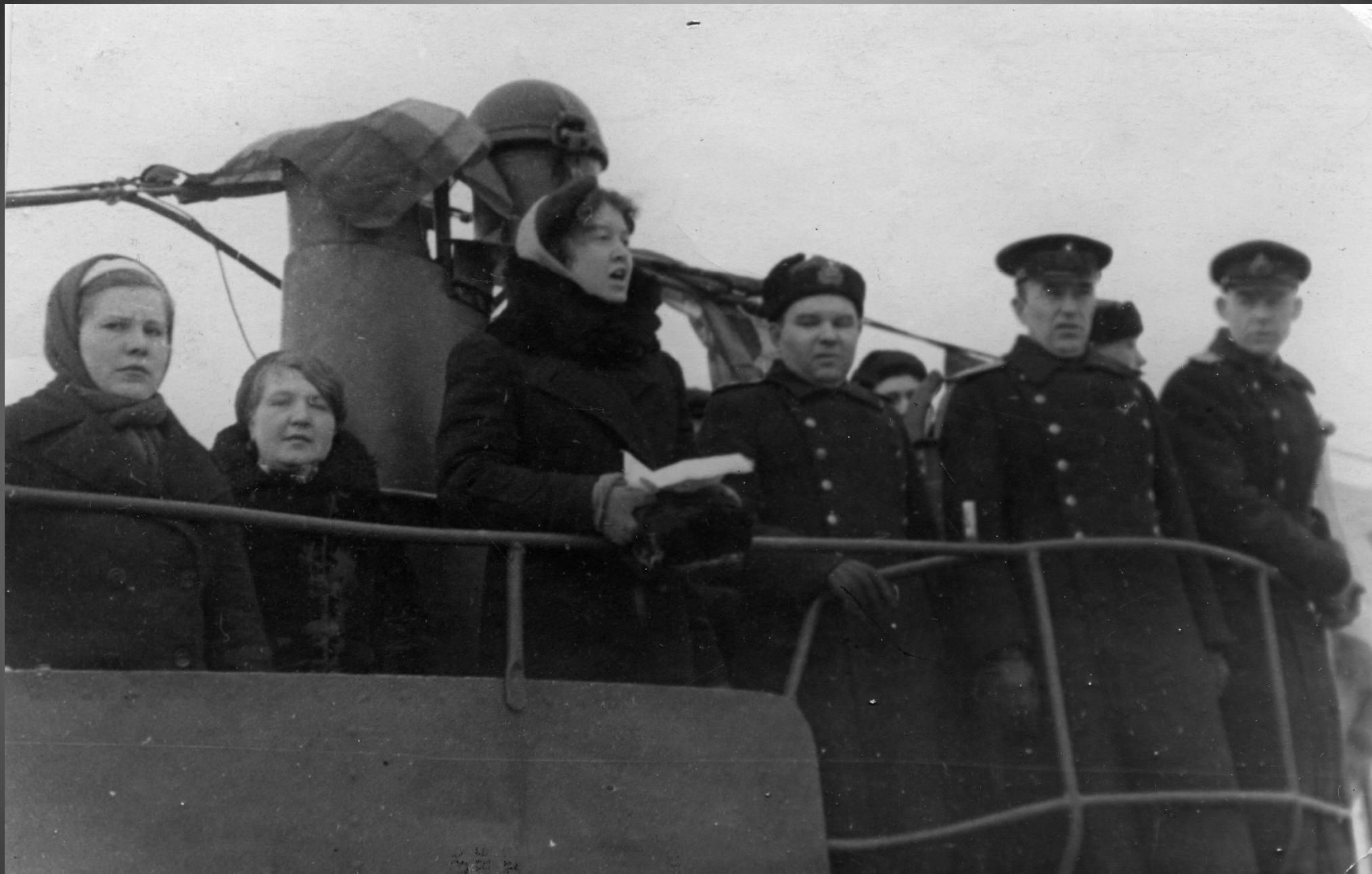
Митинг на церемонии передачи подводной лодки ВМФ. 1943