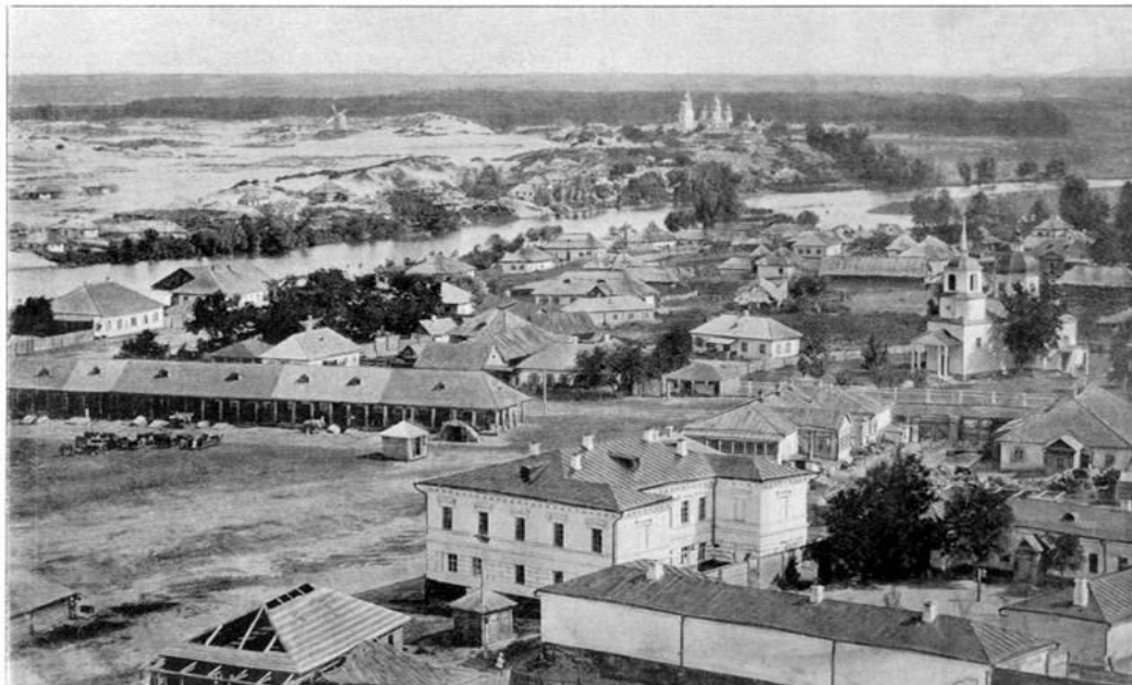
ЧИГИРИНЕ — УЧЕ ГЕНЕРАЛЕ

Утім, вірогіднішою є версія про відантропонімічне походження назви міста. Припускають, що воно походить від татарського імені Чигир . Крім того, у пам'ятках тих часів згадується Чигир-Батир. Підтвердженням такої версії, зокрема, слугує присвійний суфікс -ин у назві міста