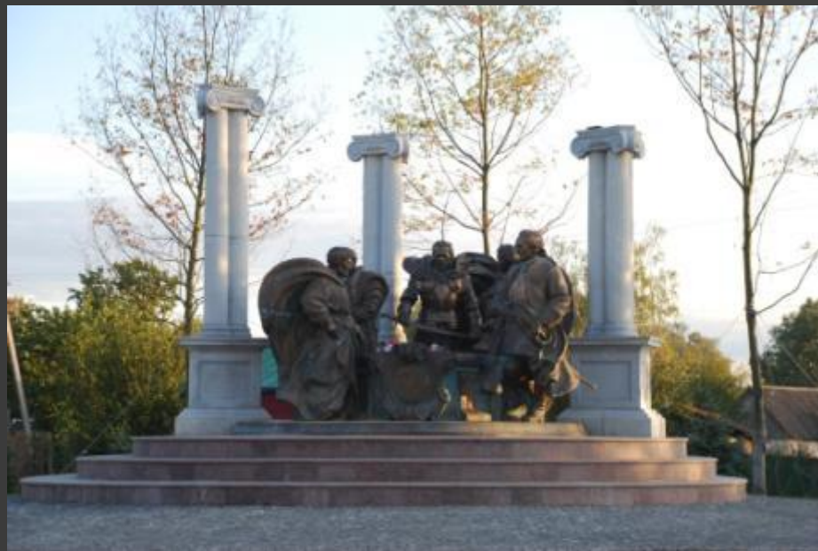
Скульптурна група Гетьманам Многогрішному, Самойловичу, Мазепі, Розумовському