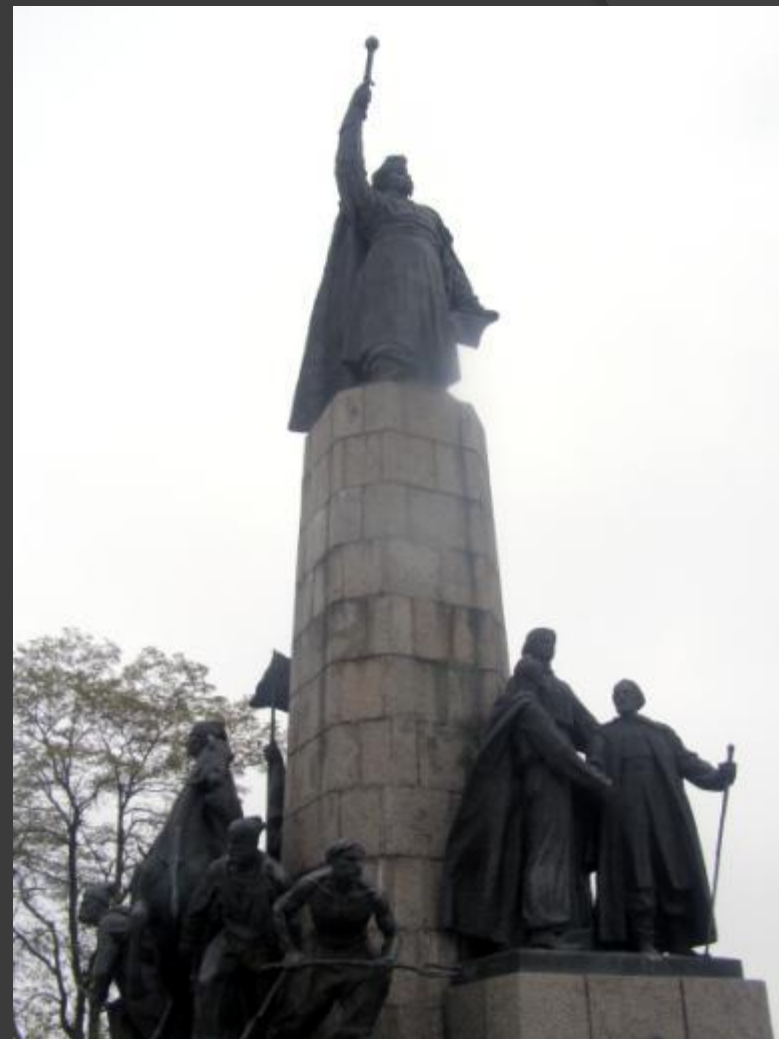
Пам'ятник Б.Хмельницькому на Замковій горі

З історичних джерел відомо, що Чигирин правив за резиденцію і наступним гетьманам – Івану Виговському, Юрію Хмельницькому, Павлу Тетері та Петру Дорошенку