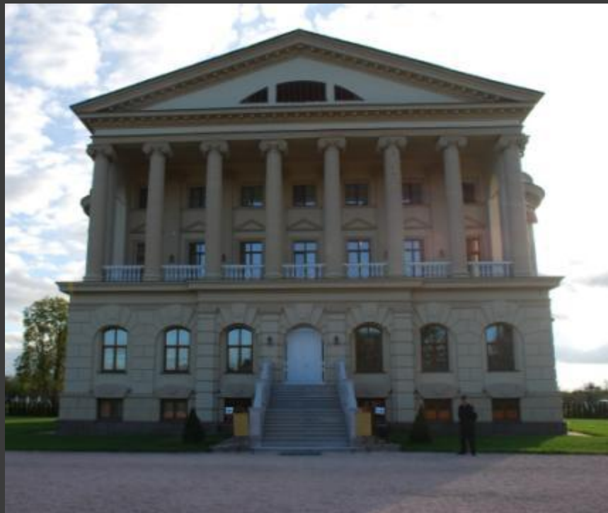
Палац останнього гетьмана Кирила Розумовського