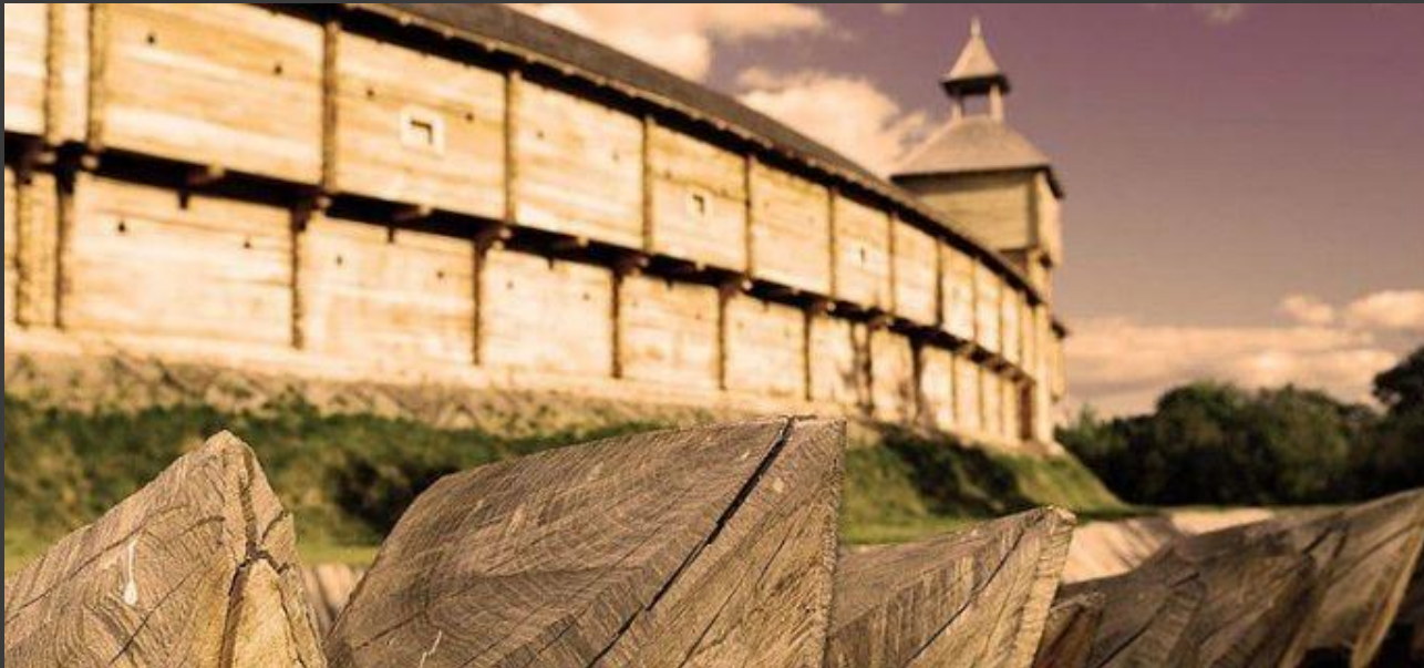
Відбудована Батуринська Цитадель

Назва походить швидше за все або від руського діалектного батура — башта, вежа або від тюркського імені Батур (Патур, Петер, Петро або за іншою версію Батир — богатир), серед носіїв якого є відомі князі-мурзи часів Золотої Орди . Деякі вчені вважають, що назва походить від імені польського короля Стефана Баторія , який заснував місто.