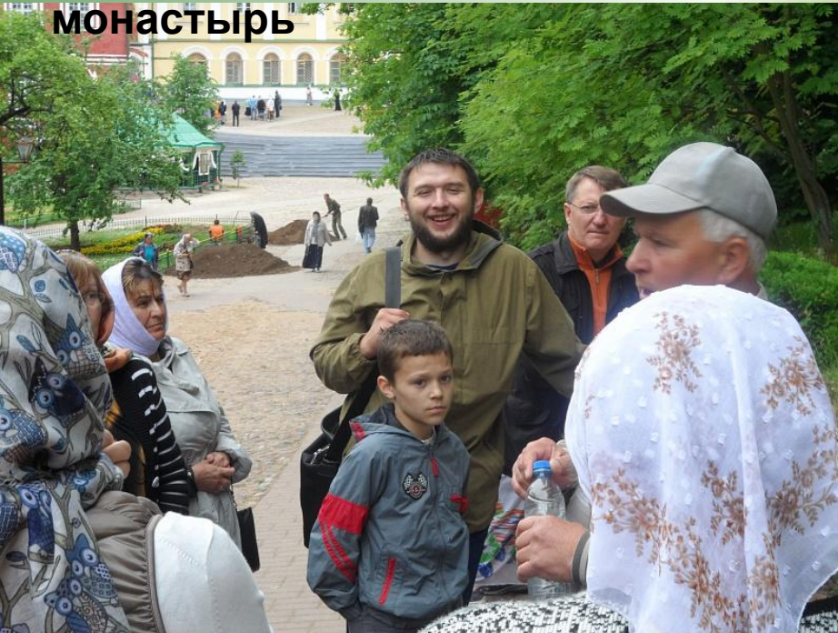
Псково-Печерский мужской монастырь